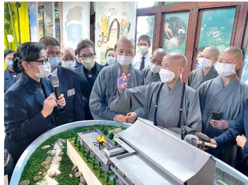
上人来到台南善化联络处，并参观环保教育馆布置。（1月2日）

最近上人常以“火金姑”（萤火虫）譬喻，人人的心中都有像是萤火虫所发出的微光，点点微光会合起来，也可以成为在黑暗中指引方向的一盏灯。“佛陀说世间昏暗，让凡夫无