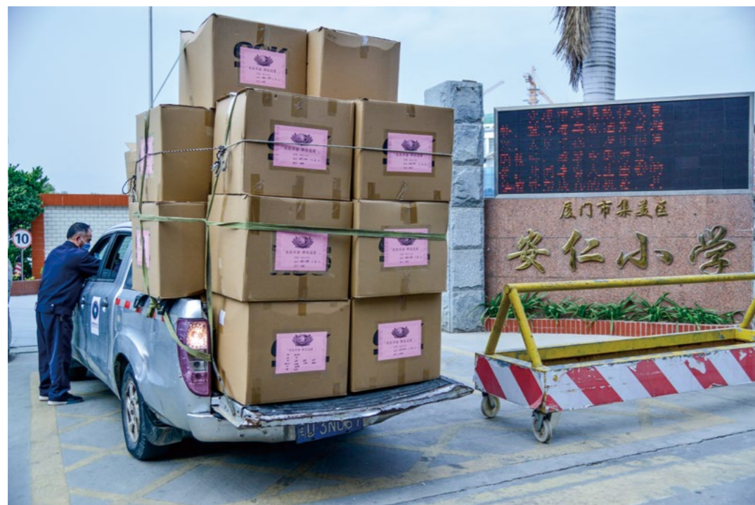
志工载着满满的爱心物资到安仁小学，进校前，依照疫情管理规定，接受学校工作人员的体温检测，并出示健康码。

操场上，学生排好整齐的方队，左手竖着食指搭在左边同学的掌心处，右手掌心盖在右边学生的食指上，集中注意力听口令，只见左手忙着“逃跑”，右手忙着“抓贼”，学生们又紧张又开心，顾此失彼，欢笑