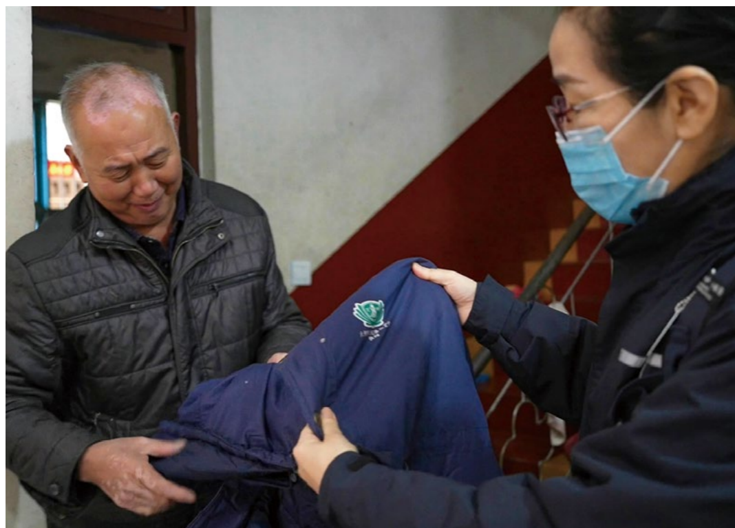
看到慈济人到来，李大爷兴奋地拿出1998年建瓯水灾时，慈济捐赠的棉大衣，一脸暖意地与志工忆当年往事。