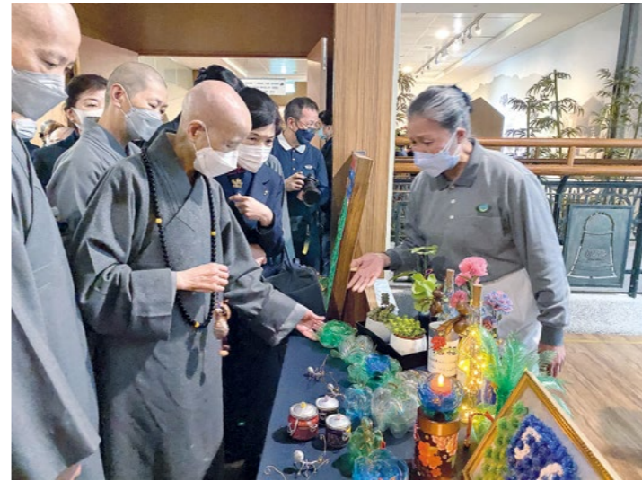
上人抵达台中静思堂，绕视人文布展，观赏以塑料瓶回收再制的巧艺品。（1月10日）

投联络处。志工拿着竹风铃等各式竹制手工艺品相迎，联络处各角落布置富有巧思，竹筒莲花已经是第七代，还有竹制米箩装满五谷，喜气盈溢如同过年。