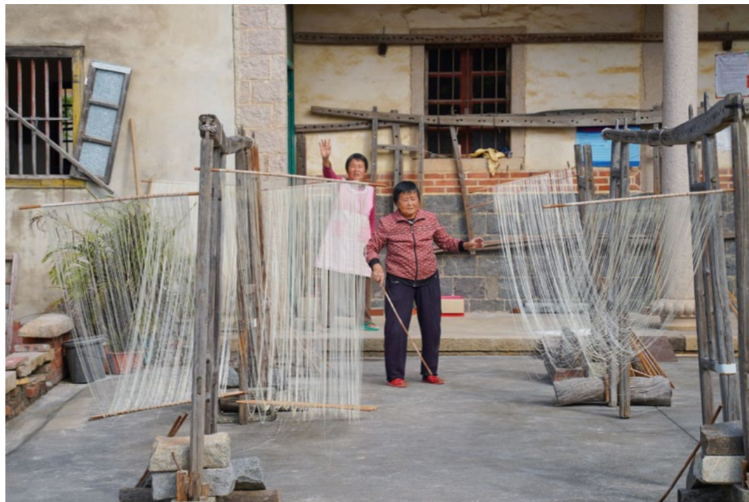
面线在户外木架子上晾晒，阳光照耀下，面如银发又如瀑布。阿菊姐妹俩挥手送别志工，直到消失在视线中。

工说起面线的制作工艺时红光满面，流露出一股专业的工匠精神。一旁的村干部补充道：“他们家的面线是我们村里最出名最有质量保证的，生意非常好，受到产量的限制经常供不应求。”