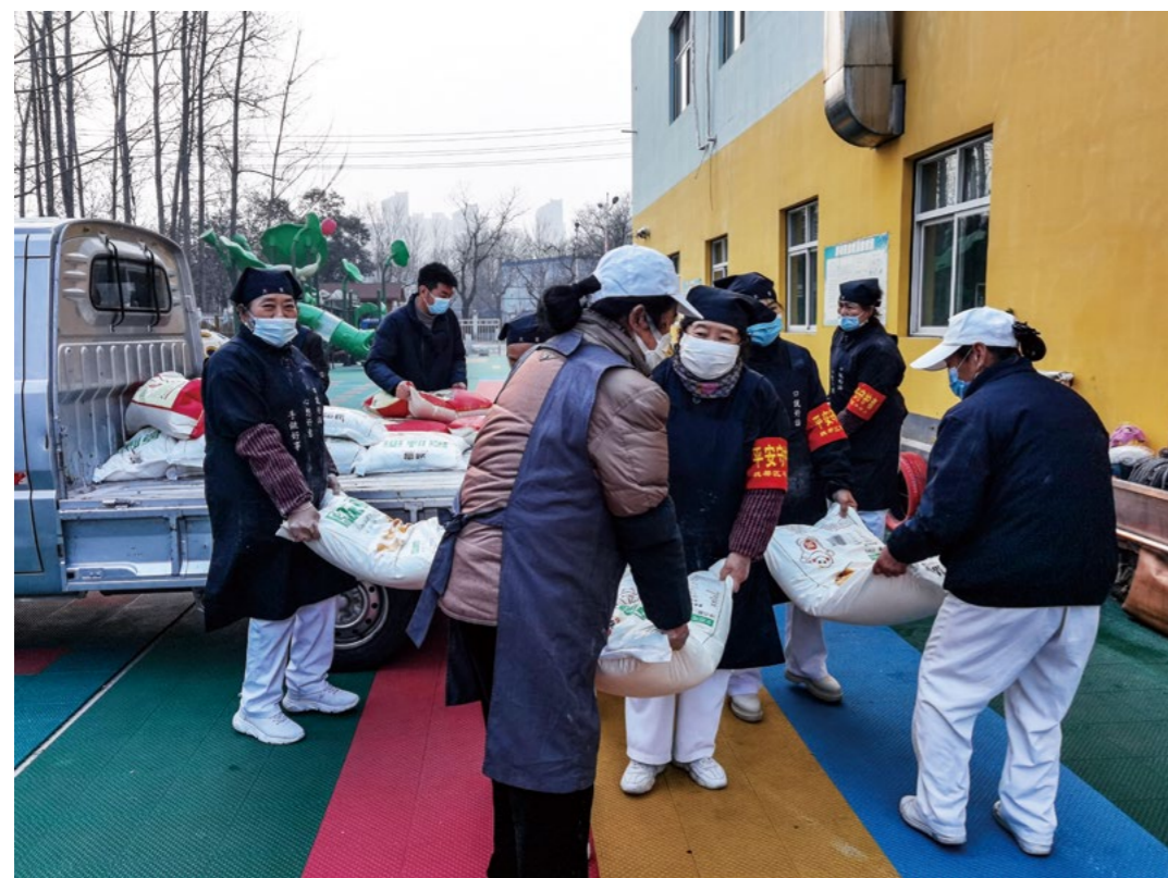
新兴路街道办事处防疫工作者载着10袋白面、11袋大米到制作蔬食的幼儿园，他们迅速把物资搬运到储物间后，转身就走。