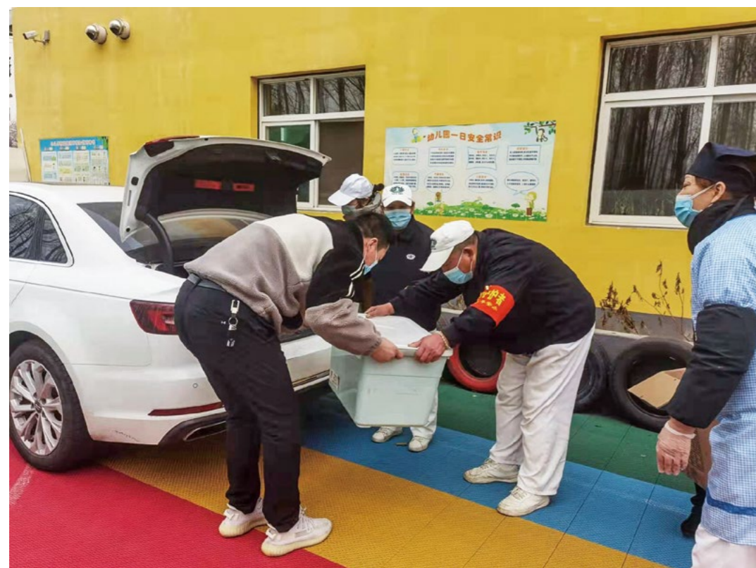
感动于志工的无私付出，部分社区的工作人员，主动前来取餐，以减轻志工的工作量，彼此恭敬弯腰递接受爱心餐。