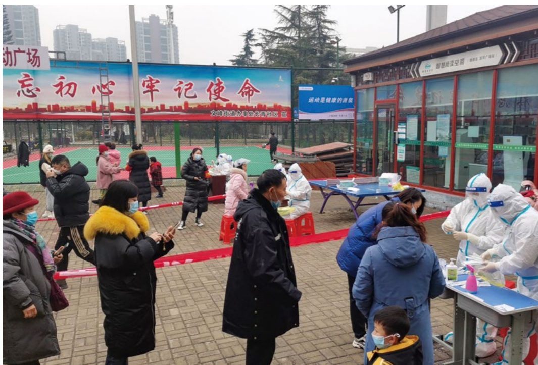
1月7日上午，长青社区门前广场，昨天未采样的附近居民集中于此进行，正在进行核酸采样，且须在十二点前全部完成。

2022年1月4日，许昌市下辖的禹州市出现两例确诊病例。应新冠肺炎疫情防控需要，许昌市发布通知，学校