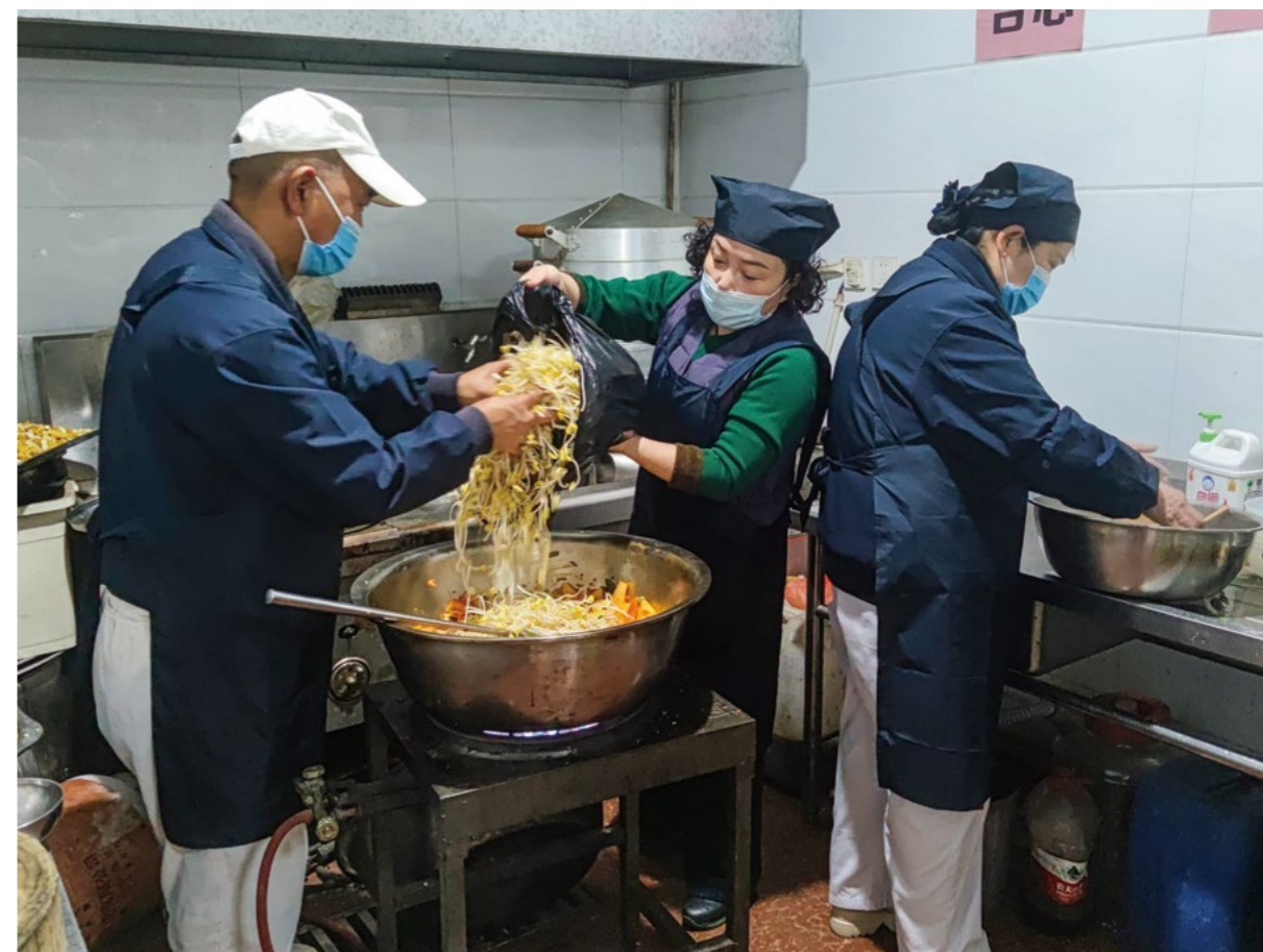
志工为一线工作人员和志愿者准备色香味俱全的河南特色蒸卤面，热气腾腾的蔬食带着满满祝福，将被送往各个社区。