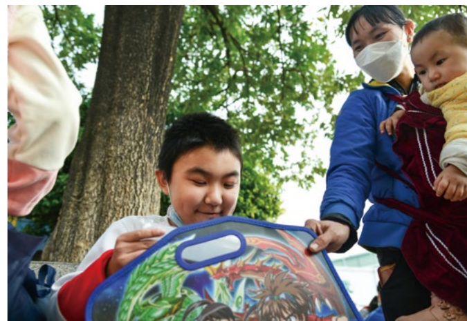
领到衣物用品包后，孩子兴奋地打开手提袋，迫不及待地跟妈妈介绍爱心物资：全新的衣裤、保温水杯、文具盒……

爱是越分越多的，慈济志工带进校园的感恩心和爱心，像一颗颗小小的种子，洒播进师生的心中，将来会长成参天大树，再去庇护更弱小的幼苗；爱的传承，善的传播将会让校园变得更可爱，世界变得更美好。 ❷