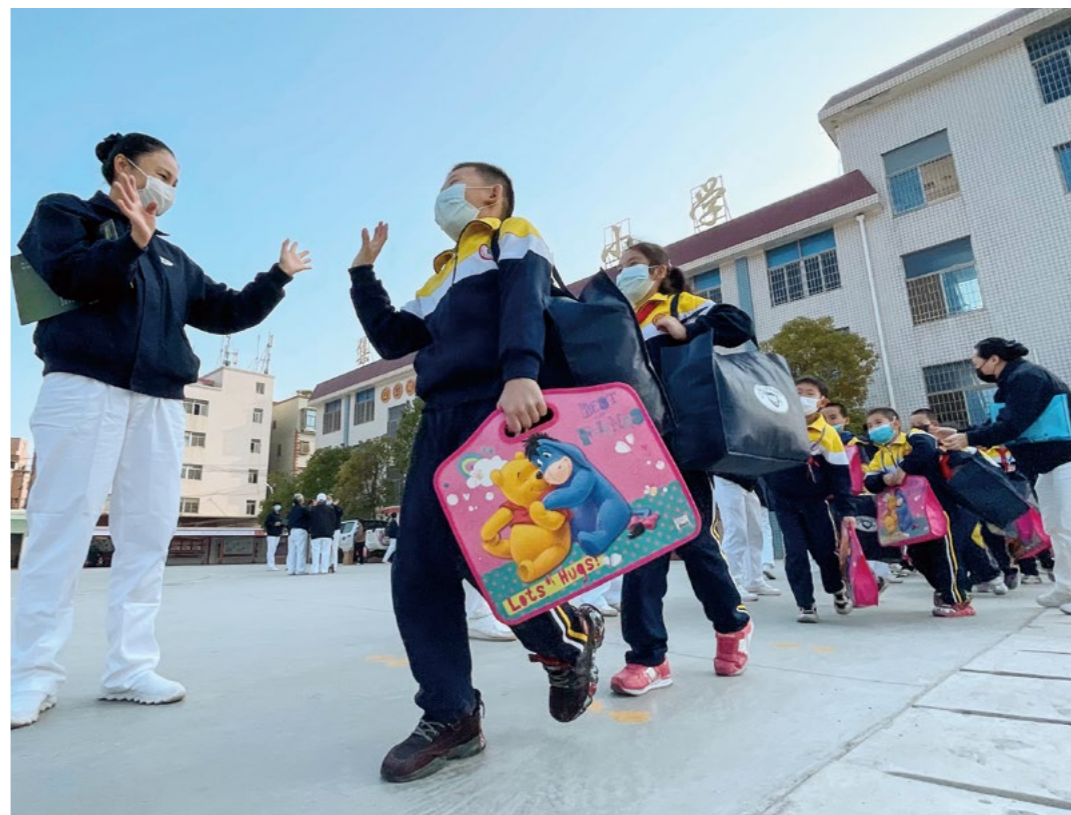
孩子们手提肩背物资，列队回家，向志工挥手道别。志工也伸出双手，不停地挥动着，嘱咐孩子们路上注意安全。

声久久萦绕，“今天的活动，孩子们感到很幸福、很开心，深深感受到志工给予的爱。”杏美小学刘娟主任如是说。