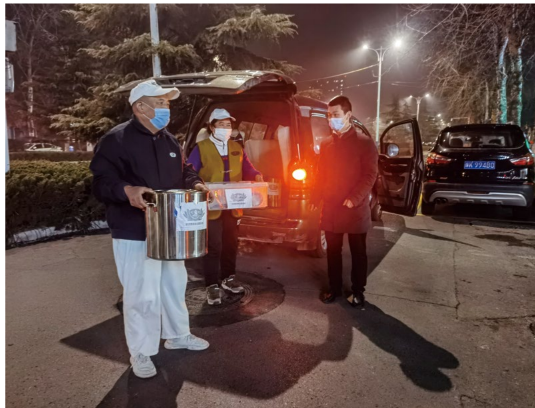
志工为董庄社区防疫卡点工作人员送去晚餐，只见他们在路边搭的塑料帐篷里执勤，薄薄的塑料帐篷根本挡不住逼人的寒气。

志工为董庄社区防疫卡点工作人员送去晚餐，看到他们就在路边搭的塑料帐篷里执勤，薄薄的塑料帐篷根本挡不住逼人的寒气。晚9点30分，志工送姜糖茶到长青社区，工作人员都还在忙碌中。一位工作人员边工作边啃凉烧