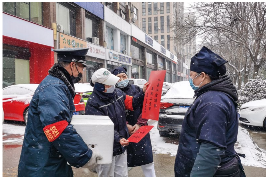
志工为在寒风中坚守的君悦小区防疫人员送上蔬食餐，并送上静思语春联，分享静思语的意涵，值班人员非常认同。

志工送餐的视频经由当地媒体传播，让更多人了解慈济。期待未来，这一份爱在许昌持续生长、绵延。