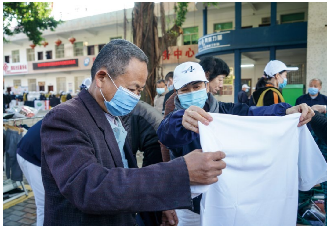
发放仪式开始前，最热闹的当属惜福区，乡亲如同进入服装专卖店，他们细致地挑选衣服，志工从旁协助提供参考意见。