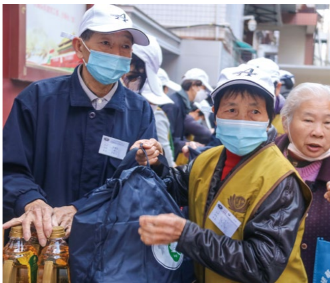
阿琴瘦小的身体，却步履坚定，笑容满面地陪着乡亲领取物资，她表示，能够帮助比自己更苦的人是一件幸福的事。

“我今天真的是太感动了，心情也特别高兴！”第一次参加寒冬送暖活动，协助乡亲领物资的阿琴，觉得自己能够帮助别人是件幸福的事。