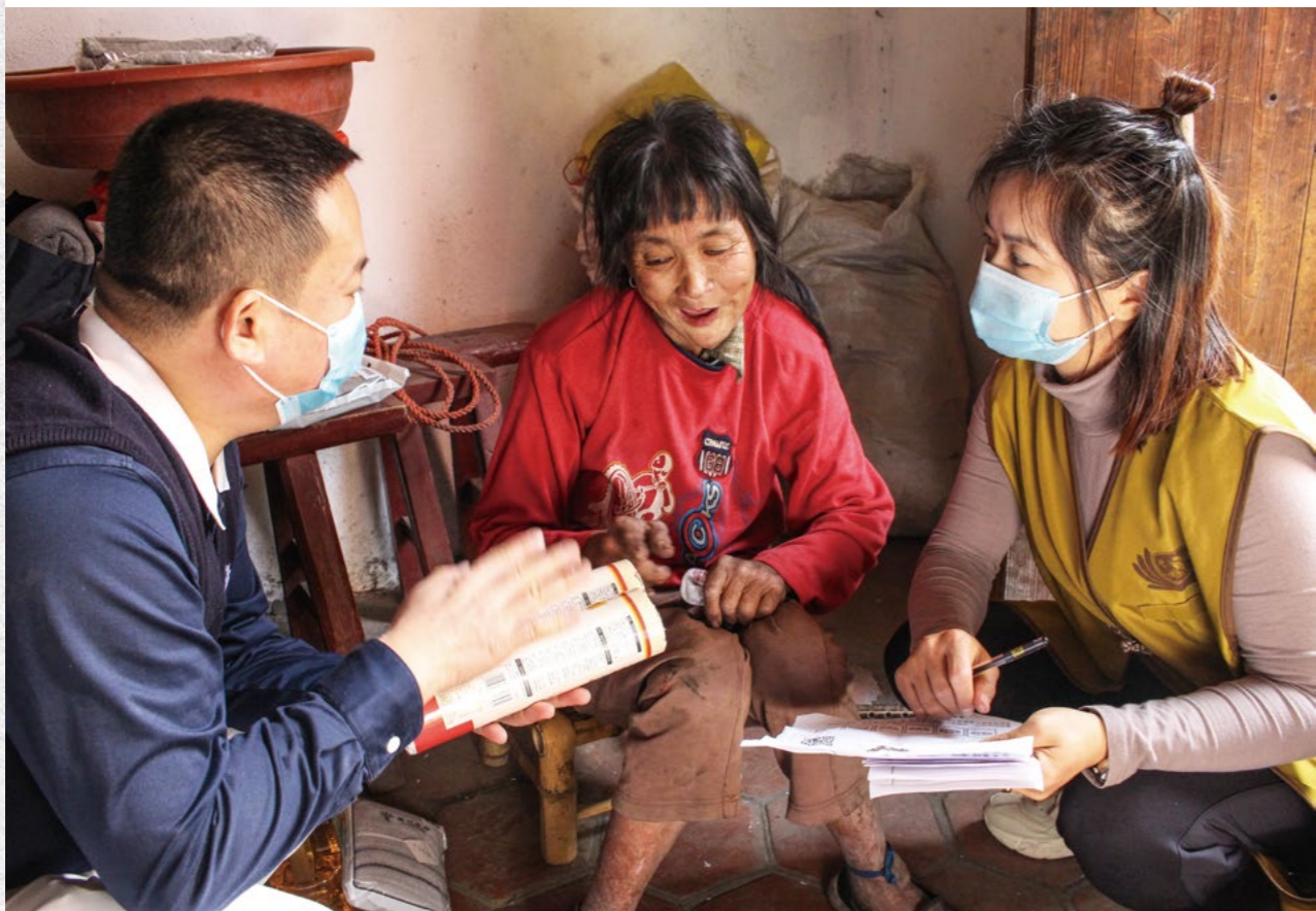
看到志工的到来，阿芬激动地道感恩，向志工倾诉自己一生的悲苦。志工宽心抚慰，并向她一一介绍物资的来源和意涵。

阿芬拄着两支拐杖，晃悠悠地走过来，志工赶忙上前搀扶。身体羸弱的阿芬，脸上满是岁月的沧桑，她激动地抹着眼泪，“我腿脚不便，让你们久等了。”