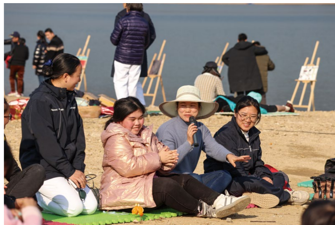
志工引领家长共读《清静在源头》，身处这片通过弯腰做环保而变得更加美丽的环境中，每位参与者分享此次活动的感受。