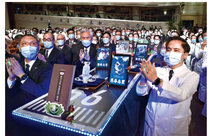
花莲四大志业主管同仁齐聚静思堂参与授证暨岁末祝福典礼，虔诚发愿。

到管制，国际间的慈济人难以返台相见，幸好科技发达，可以藉由网络视讯见面交谈。“即使无法当面互动，视讯把我们的情又拉近了，心贴在一起，彼此感恩、相互祝福。师父要呼吁全球慈济人，不论在哪一个国家、哪一个种族，我们都要共同一心，提起‘人之初，性本善’的本性之爱，与天地共生息，彼此爱护。”上人勉众信、愿、行——相信能够为大众付出的生命，是最有价值的；起信心就要发愿，任何宗教都注重发愿、发誓；有愿就有力，承担责任并且身体力行，再困难的事也做得到。人生在世会面对种种境界，要经得起考验，要堪忍身心之苦。上人与众共勉，要修大忍、大信、大悟之心；有大忍的心，才能笃定自在，不能让人因为自己的担忧着急也跟着恐慌，总是要冷静、笃定，把握时间做好该做的事。