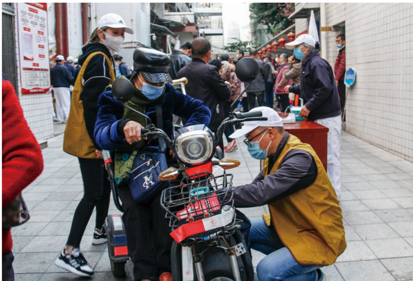
现场的乡亲大都上了年纪，大米、食用油、生活包重量沉，志工帮忙把物资妥帖地放置在他们的车上。

“我的命运很坎坷，好苦啊。”才说了一句，泪花就在阿梅的眼眶中打转。八年前，阿梅的丈夫从猪圈上不小心摔落下来，头部受伤，早期生活无法自理。几经治疗，现在虽能四处走动，但由于脑部受损较重，变得认知不清，一出门就找不到回家的路。阿梅只能寸步不离地守着他，有时去地里种菜，也要带上丈夫，小心地看护。