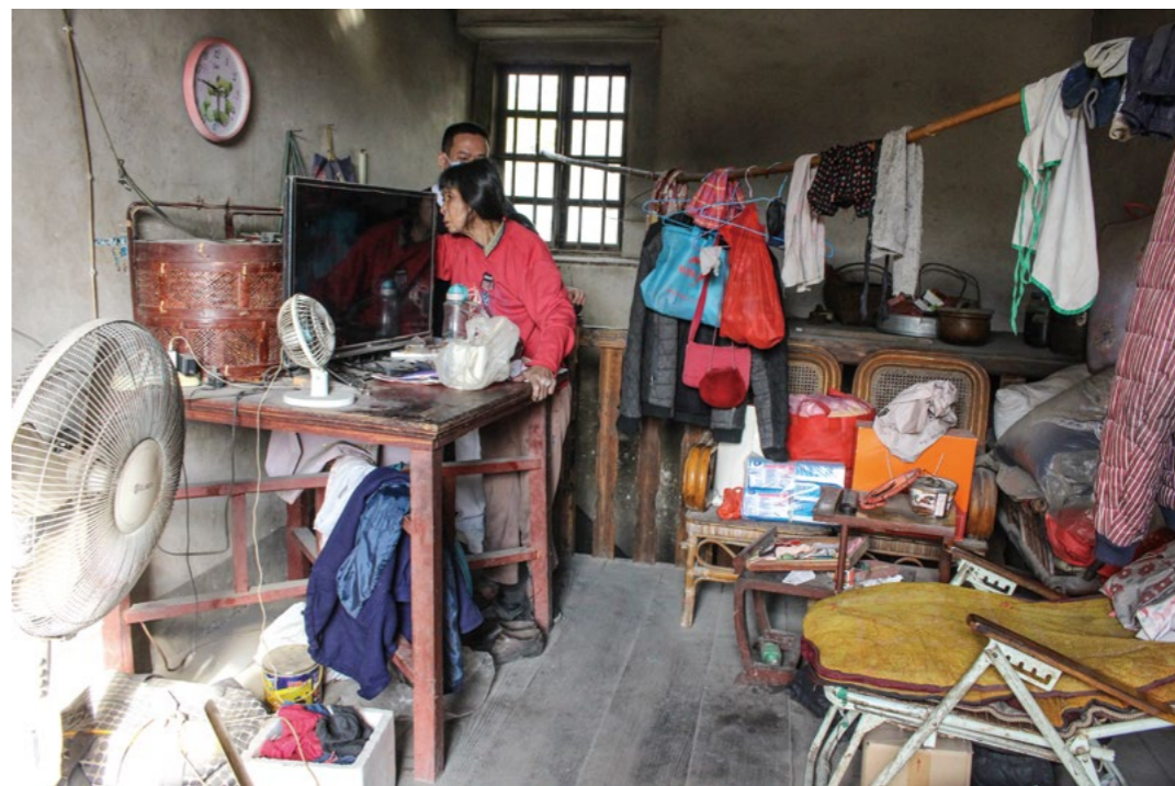
阿芬平时住在二楼，腿脚不便的她每爬一次楼梯就要耗尽全身的力气。她的卧室堆满杂物，一张躺椅便是她的床。

已逾花甲之年的阿菊与姐姐相伴，阿菊因患小儿麻痹，右肢略有畸形，左肢因痛风肿大，要扶墙才能移