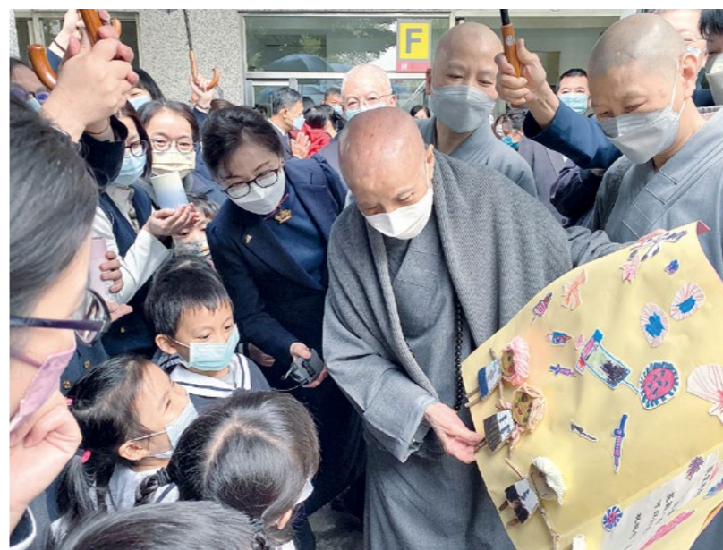
上人即将自大林慈院北上彰化，大爱幼儿园小朋友呈予竹筒及卡片。（1月7日）

慈济人也要用父母心长久陪伴：“慈济人视天下的孩子如同儿女，永远地陪伴着他们；只要他们不忘记