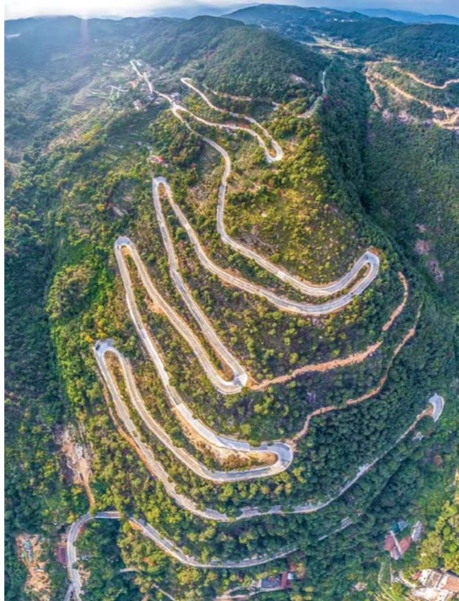
西天尾镇下垵村位于九华山麓，村民因地制宜从养殖业转型种植枇杷等经济作物，并大力发展乡村旅游业。

许冬红院长在天马村村委会的寒冬送暖发放现场，用通俗的语言向乡亲介绍慈济在慈善、环保方面的用心付出，“慈济人以天下人为亲，不是