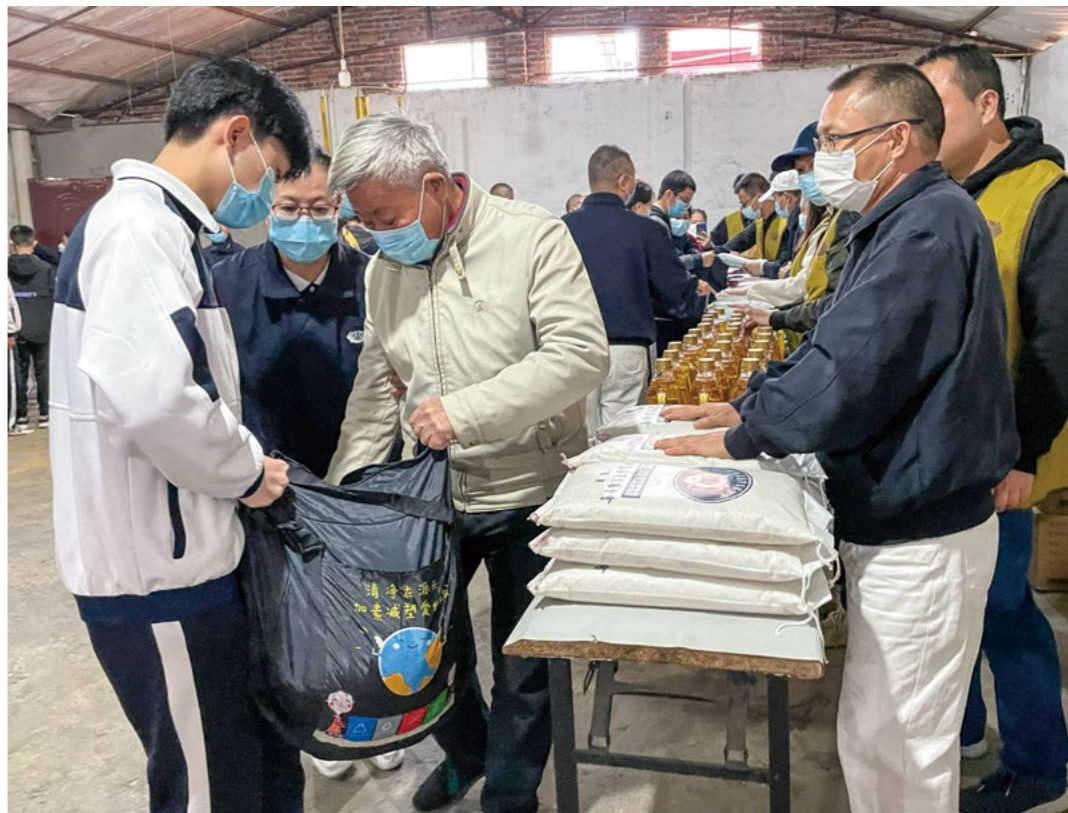
此次，寒冬送暖活动也是南安洪濑新侨中学发放慈济新芽助学金的日子，助学生们一早来到环保站，帮助乡亲搬物资。

“今天来参加活动挺开心的，我要做一个充满爱心的人。”助学生小菲与同学合力把大米抬到动线上，整齐堆叠，“在付出中，我体会到物资