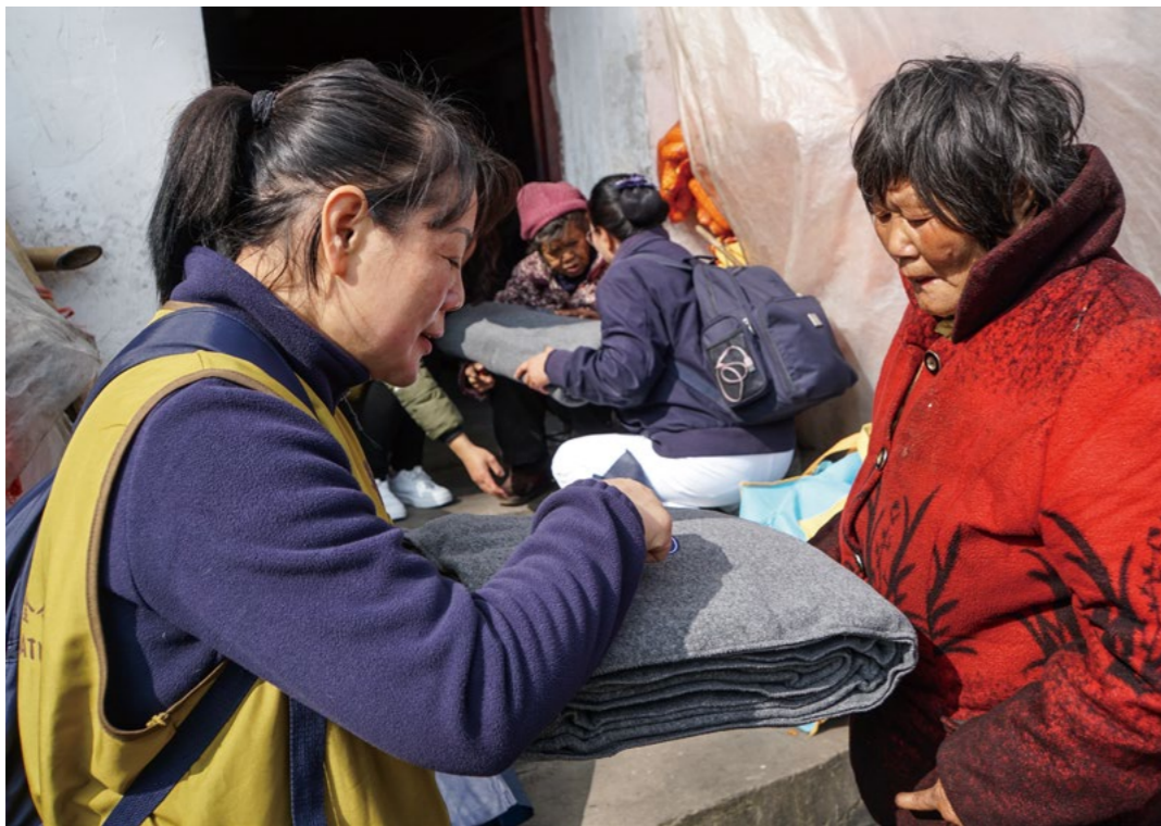
阿梅患有精神残疾，在志工的鼓励下，将客厅地板打扫得特别干净，志工连连夸赞，并试着跟她介绍环保毛毯，教她做环保。

环保毛毯和一些床上用品，物资卡里还有钱，有什么需要购买的，下次过来时，再帮您带来……”志工提着物品一一介绍，阿琼看着满屋子的物品，不停地笑着说：“你们太好了，你们太好了。”