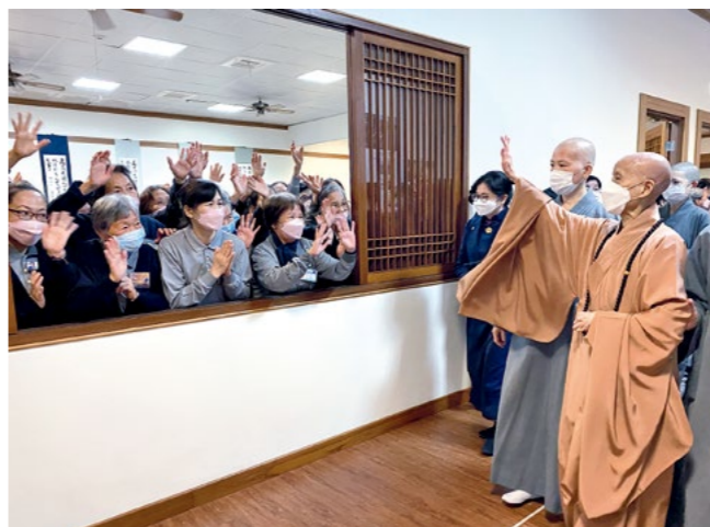
云嘉区第二场授证暨岁末祝福典礼结束后，大众向上人挥手道别。（1月4日）

“我总是告诉远方的弟子，一定要带动当地居民多造福，地方才会平安。人人的爱心付出不必求多，点点滴滴的微弱力量，就像滴水入大缸，盛满一缸水，可以供应许多人解渴，而这一缸里的水包含人人付出的一滴水，人托人的福，可以造福地方。”