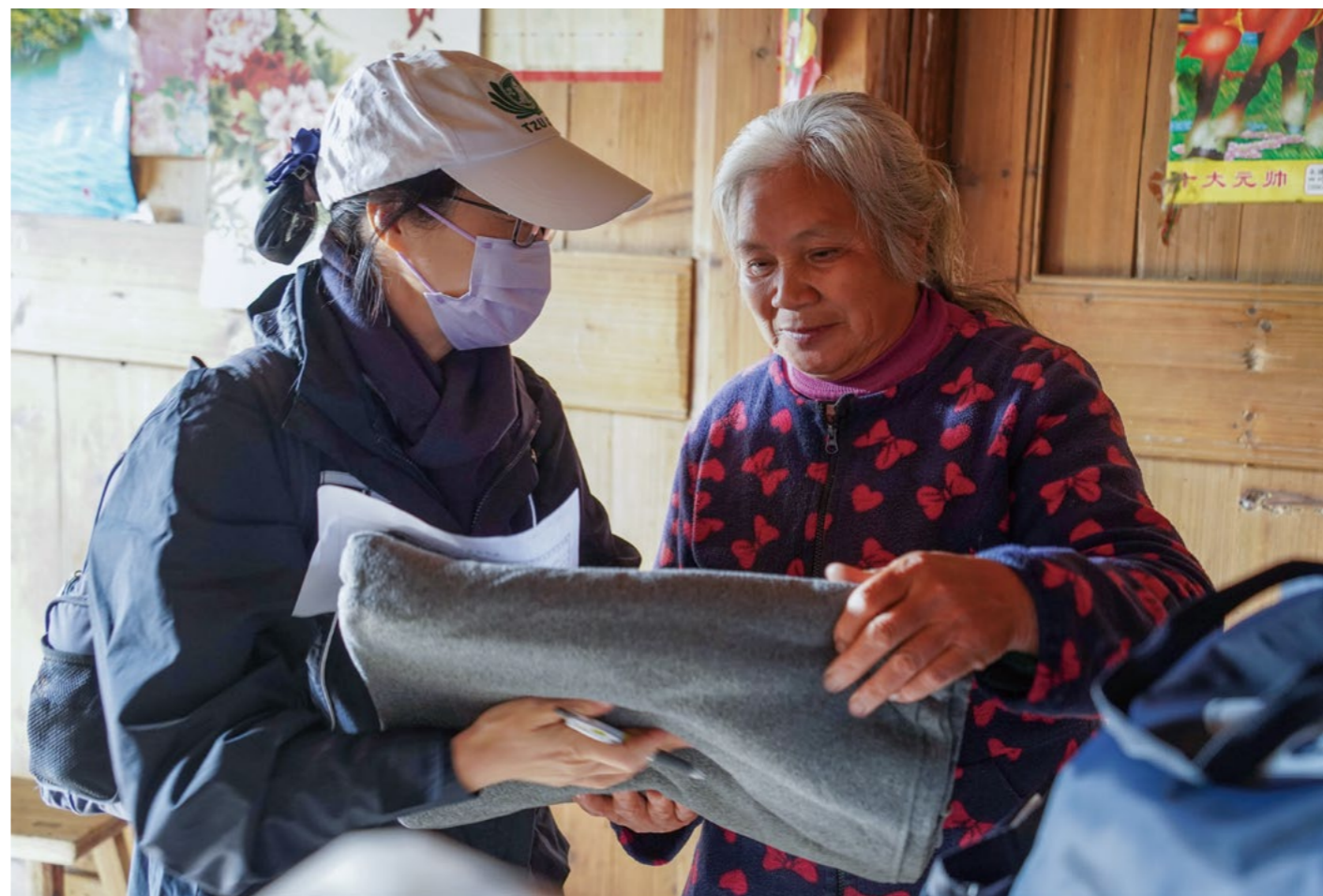
忧心子女身体状况的黄妈妈，不满60岁，已满头白发，接过志工手中的环保毛毯，专注地听着塑料瓶变废为宝的故事。