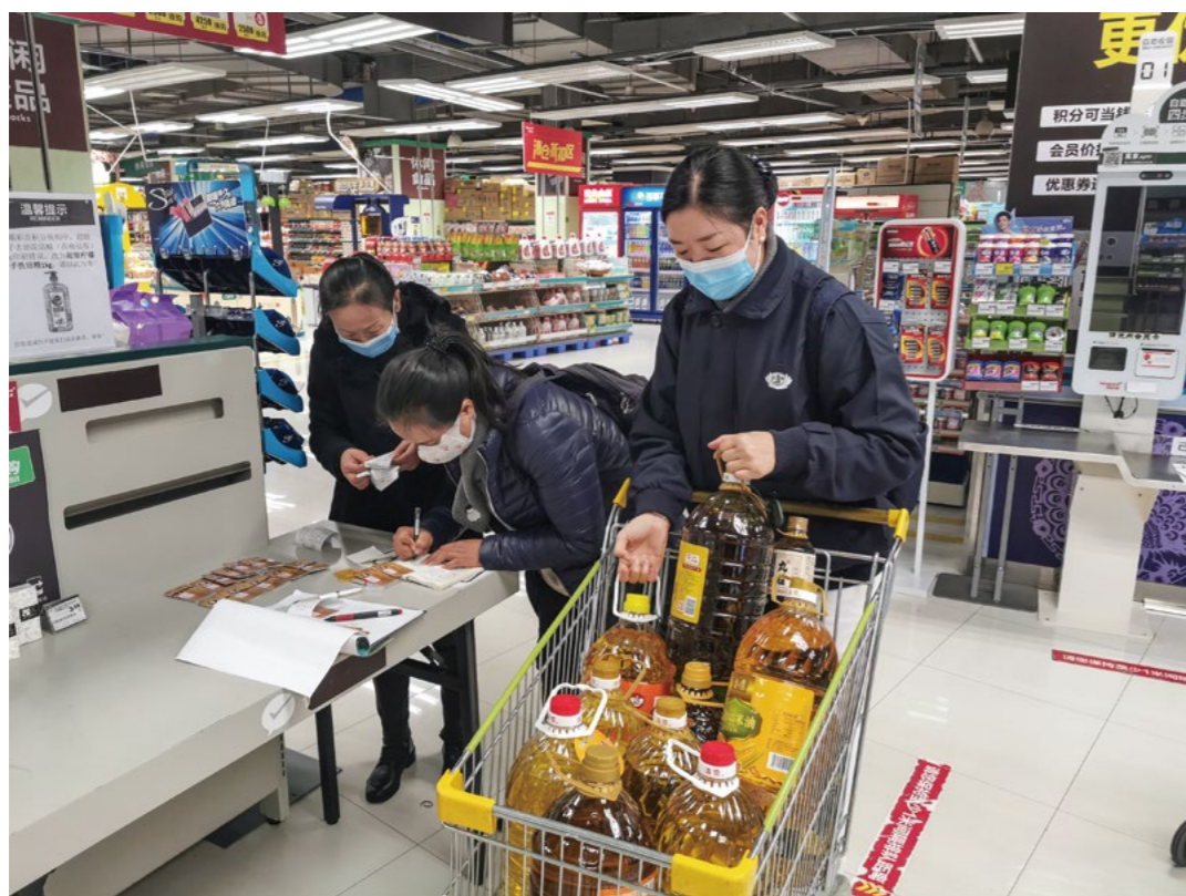
志工提前三天到超市采买发放的物资，他们一边对比着食用油、电饭锅等物品的性价，一边核对物资清单，清点购物卡。

小新村狭窄的村道边，一位缺失左小臂的老妇人，穿着泛白的紫色上衣，褐色长裤搭配着褪色的红布鞋，看着多了几分精气神。她不时地朝村头望去，脸上突然绽放出笑容。