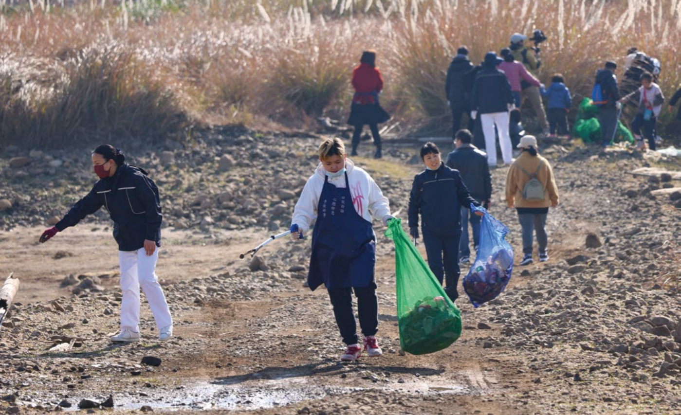
环保小卫士的家长以身作则，带孩子力行，为这片美丽的土地奉献自己的爱，体现了身教胜于言传的家庭教育氛围。