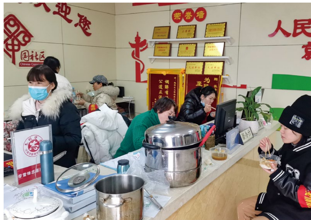
医务工作者和社区工作人员看到送来的热汤面，一人一碗，汤桶很快见底。他们表示，能吃上暖心合口味的餐点，特别开心！

原来社区正在进行二次核酸采样，时间紧顾不上吃饭，更没空来取餐。了解情况后，志工马上把午餐送过去。