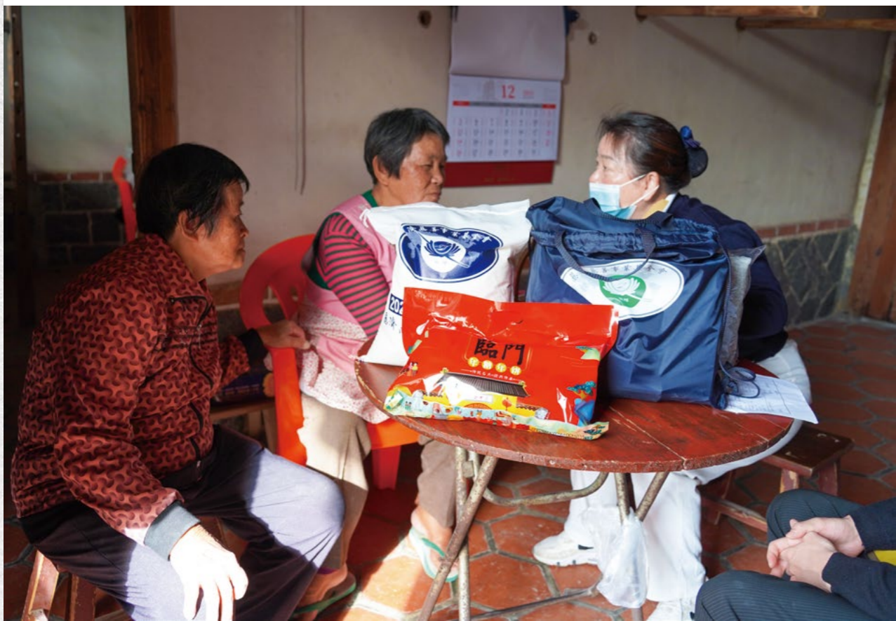
阿菊患有小儿麻痹症，姐姐未婚，姐妹俩一辈子相依为命。看到志工送来的物资，姐妹俩很感动，不断地道感谢。