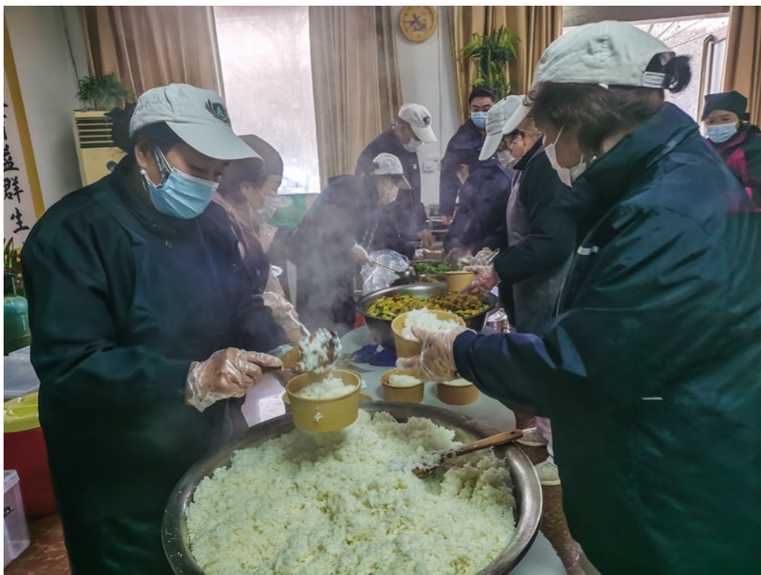
色香味俱佳的三菜一汤和白米饭新鲜出炉，志工彼此配合，快速地分装午餐，确保将爱心餐趁热送到防疫人员的手中。