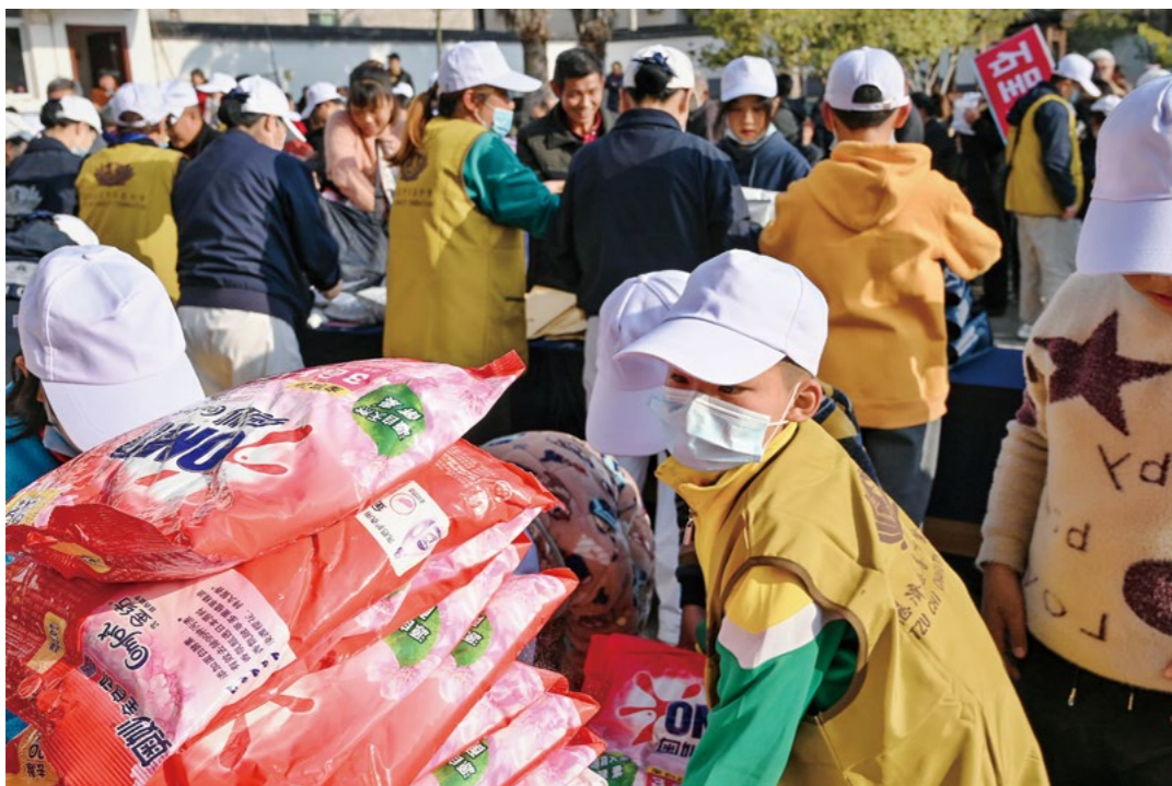
阿桂的大儿子负责补给洗衣粉，他抓着袋子的两个角，用力向下抖动，再用手掌拍平，只为让领取物资的爷爷奶奶开心。

正午，湛蓝的天空清澈明朗，冬日的阳光将温暖洒遍建瓯，悠悠的桂花香沁人心脾。这里真是一方美丽的田园，爱心绵延的家园。