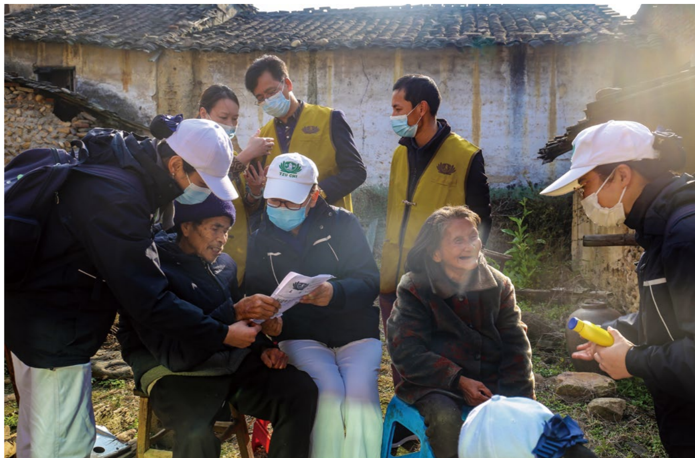
上罗村罗爷爷家，不到六七平方米的小客厅，志工搬出家里仅有的三张椅子，扶着罗爷爷和江奶奶坐到屋外草地上。