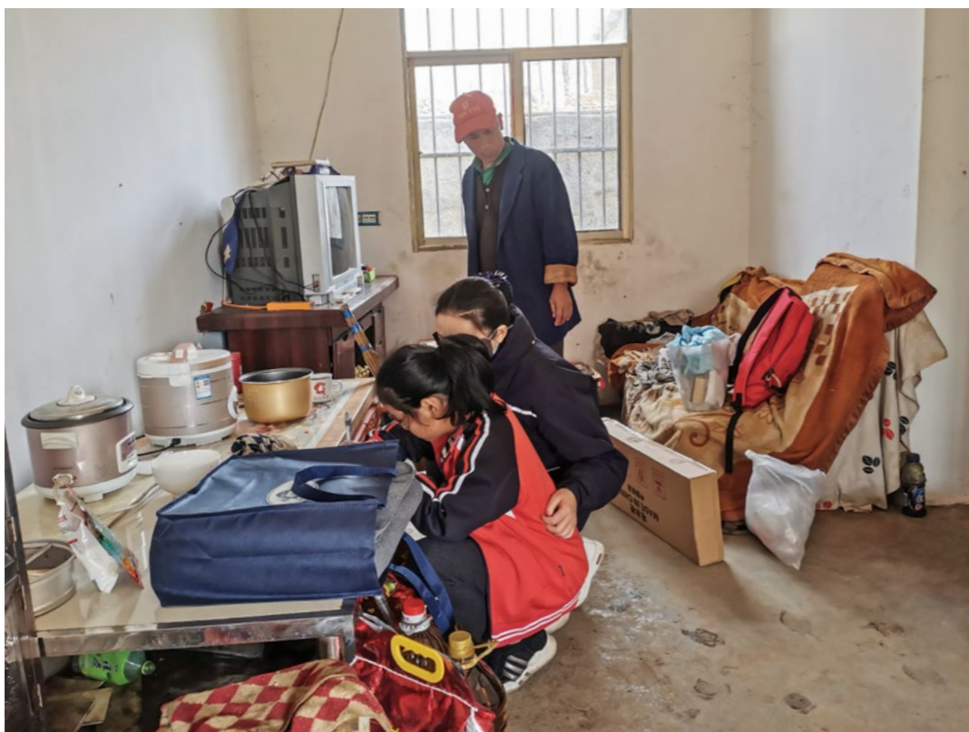
小婧的爸爸回到家，看到慈济人带来的米和油，很是感动。持续不间断的爱让他变得勤快，开始在屋前屋后种上树木和蔬菜。

“当时，满屋的苍蝇到处乱飞，空气中充满难闻的气味，饥饿的狗妈妈和几只刚出生的狗宝宝在小婧的床下瑟瑟发抖，她的鞋子灌满了狗妈妈的尿液，床上的被子又黑又潮。”2021年8月，志工协助小婧父女做居家打扫，盖雨棚，教小婧打理家务。