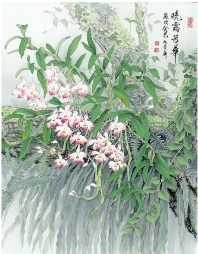
晓露芳华（局部）／陈九熹