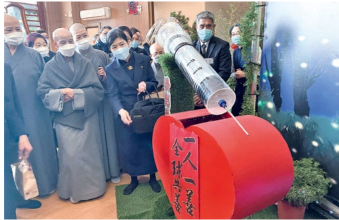
上人绕视新店静思堂一楼大厅“济剂爱心”的布置。（1月17日）

上人说，过去的民间习俗，若去探望丧家、探病，回来以后要用茛苳烧水洗身，说是可以除邪祟。遂寻思在医疗不发达的时代，这样的举措或许也有降低病菌感染的作用，或是这些特定植物确实有防护病菌的成分。“那段时间我不断在讲这件事，有一天就拜托你们分析这几种草，没想到就开始不断发现很多植物具有对人体