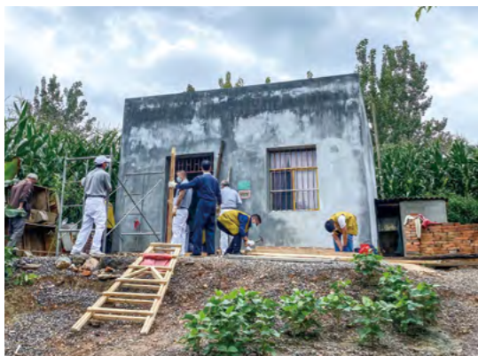
志工将带来的木材卸除抬到门边，男志工开始搭建雨棚，其他志工开车去镇上买石棉瓦和其他物料。一下午搭建，遮雨棚初具规模。