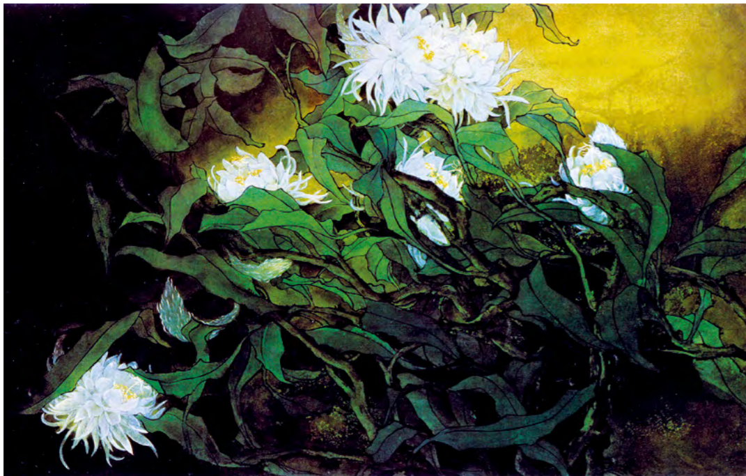
画作 / 林淑女