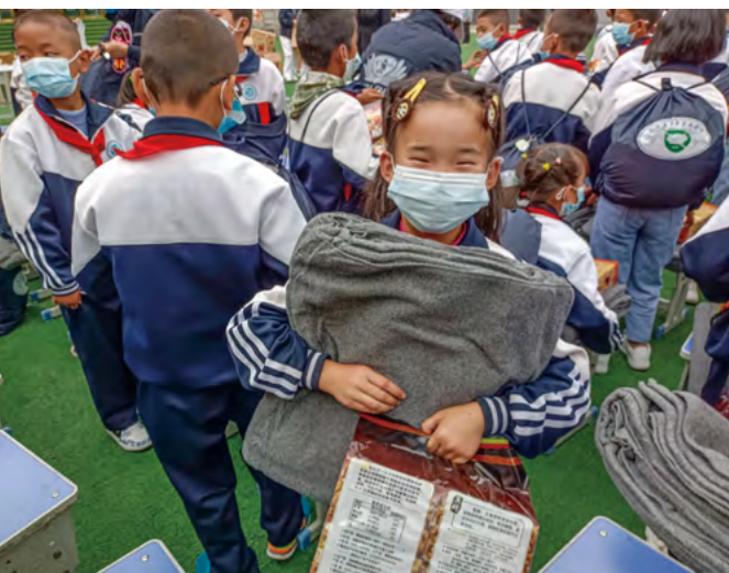
小女孩背着生活包，抱着环保毛毯，笑得眼睛眯成了一条缝，她望着志工说：“谢谢老师……”

衣服要给弟弟，围巾和保温杯给爸爸妈妈，他们打工很辛苦……”六年级的小全一边整理纸板，一边和志工聊着，黝黑的脸盘渗着汗水。志工问：“你有衣服穿吗？”孩子说：“我穿校服！”