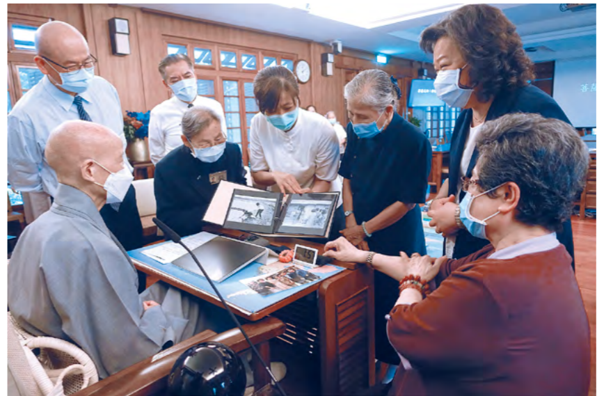
文史处主管同仁整理慈济史料，邀请资深慈济委员回顾早期历史。（10月26日）

“心定归依处，身在此地，心要跳脱苦，安住在轻安自在的境界；如果不轻安、不自在，就无法