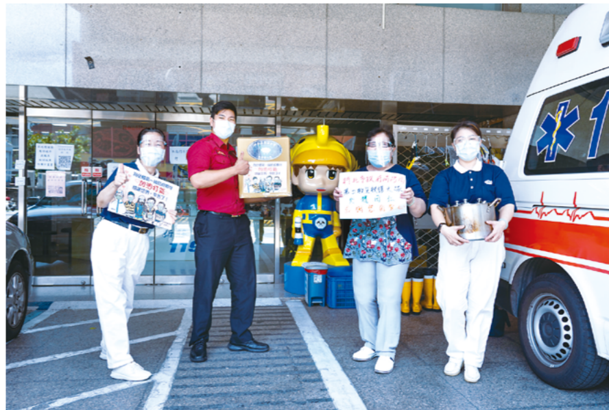
北区慈济志工赠送蔬食餐盒给警消单位，感恩他们在疫情期间的付出，也邀约他们共善共素。

上人对几个推动蔬食的年轻团队寄予厚望，期待爱与善有传人，“我从十几岁就开始茹素到现在，不断发挥爱的能量，直到现在没有停过。只要有机会能接引人，任何一个人，我都很期待能投入慈济，让爱的能量一波接一波，永恒地传下去。”