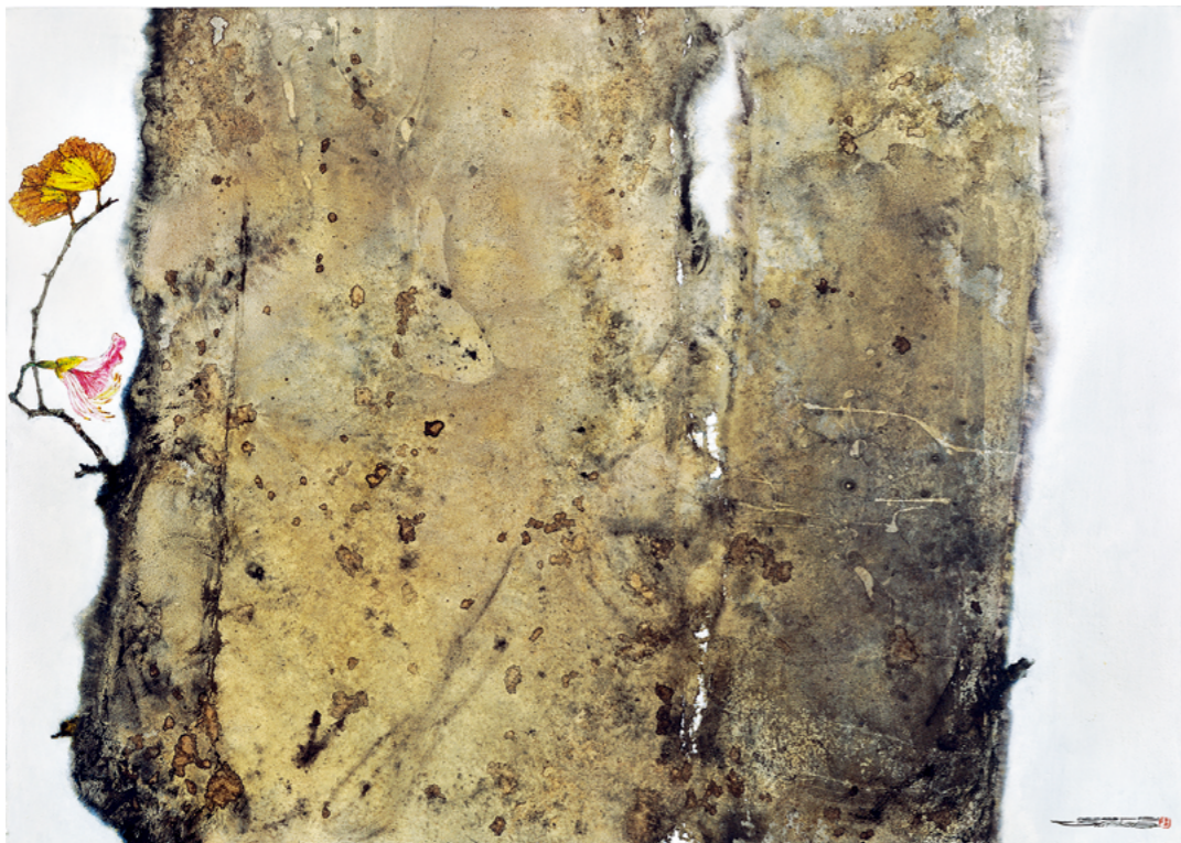
画作 / 林顺雄