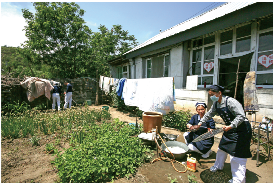
志工拆洗沙发套、被罩、翻晒被子等，从北京带来的大盘子、不锈钢屉，也一一清洗。