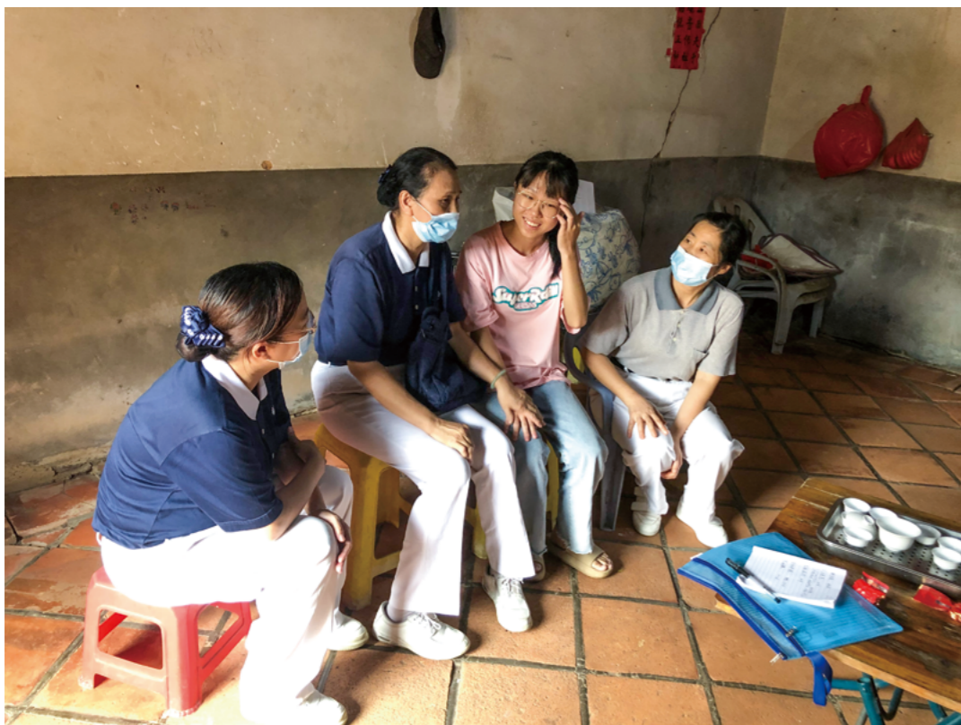
小露乖巧懂事，平时生活费都是能省则省，但学业从不曾落下，认真又刻苦。