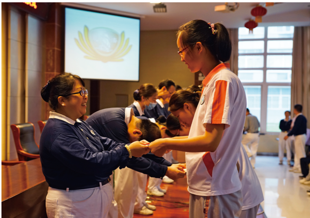
二〇一七年九月的助学金发放仪式，志工将满载全球慈济人的爱，虔诚地递到同学手中。