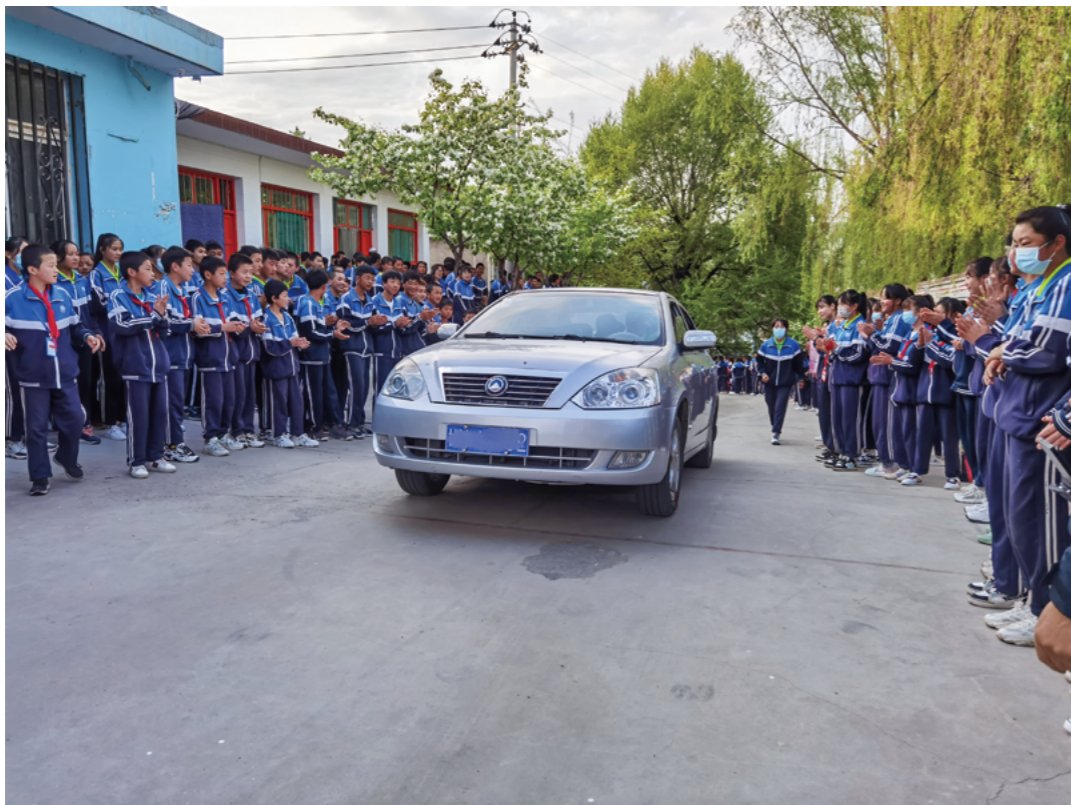
早上七点不到，三十里铺初级中学的孩子们自发在学校门口排成两列，欢迎厦门十中师生、家长及志工。