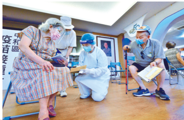
慈济提供全台多处静思堂场地成立新冠肺炎疫苗接种站，在双和静思堂，台北慈院医护和志工携手服务长者。（摄影／陈李少民）