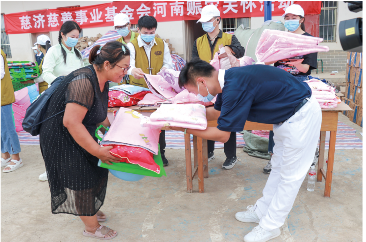
撰文/霍涛