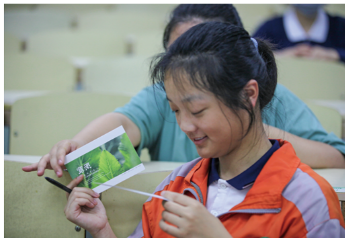
二〇二一年，慈济助学班高三同学收到志工亲手书写的祝福卡，字字句句包含着对莘莘学子的祝福与鼓励。

加慈济活动多了之后，同学们变得自信乐观了。他们勇于接受别人的爱，更重要的是他们在面对陌生人时，也能够张开怀抱来拥抱别人，这点让我觉得非常感动。”