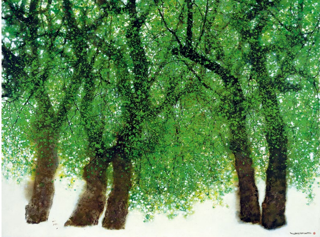
画作 / 林顺雄