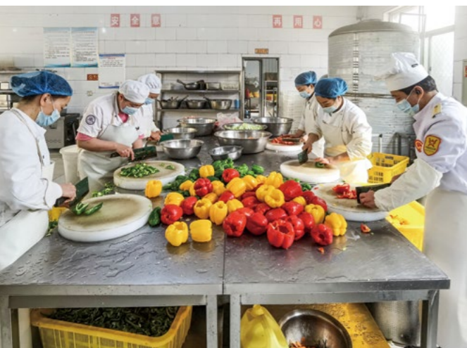
慈济提供“黑椒五彩马铃薯”菜谱和食材，将在易县中学三个食堂与七千五百多位师生见面，后厨的师傅们紧张地准备着。

心，并从中体会到蔬食带来的愉悦感。希望孩子们能够利用假期，为自己的家人做一道美味的蔬食。”