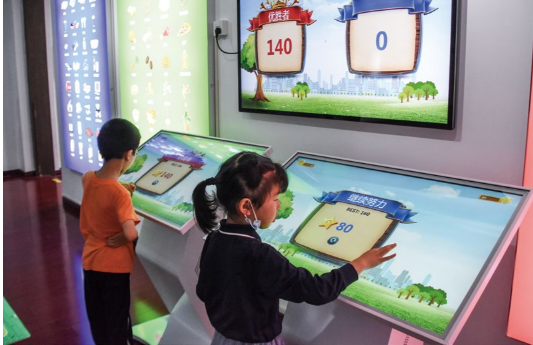
互动体验区，有孩子们喜欢的脚踏车发电-“大爱让世界亮起来”和垃圾分类大比拼，孩子们兴趣盎然，久久不愿离开。