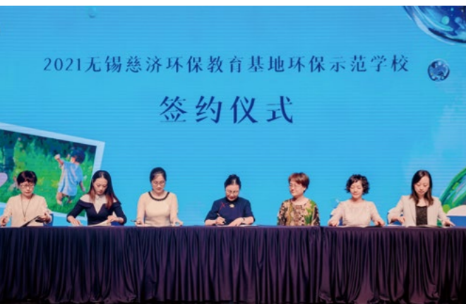
环保需要更多地向孩子去传递和实践，无锡慈济环保教育基地与环保示范学校正式签约。

约是永不过时的美德》；金桥幼儿园的小品《酵素宝贝我爱你》形象地向观众们推介了环保酵素的作用，和具体实用的制作方法。