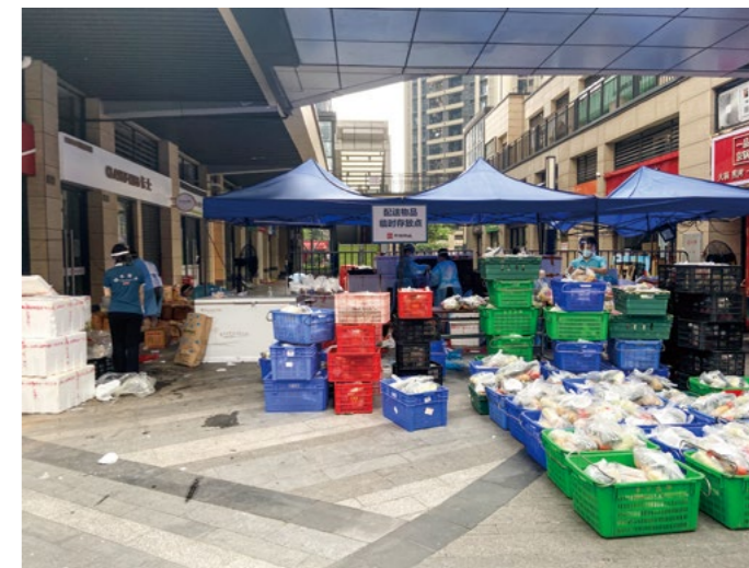
志愿者每天三班，每班三人，统一收集再整理，为邻居们送餐、送快递及生活物资，一直送到每家每户的门口。

与其坐在家里每天看着手机，担心疫情的发展，不如现在就站出来，为守护社区，安定民心做努力。甘健勤和刘芷君在业主微信群里号召大家一起做志愿者，一起为