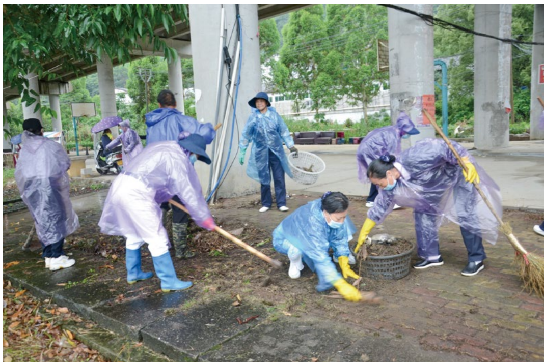
(上图) 五十位太姥山志工冒雨分组清理圣寿岭公园。工具不好用, 志工就直接用手抓, 清理出很多烂木块和塑料袋。(下图) 福州志工分享塑料袋不回收对大自然的危害, 多数店家得知志工做环保爱地球, 表示愿意响应资源回收。