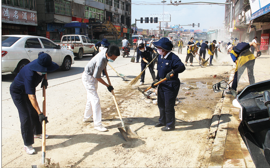
志工们正在清理泥泞脏乱的街区道路，清扫中尘土飞扬。

来的水，造成道路一大片的泥泞，有些垃圾还会发出阵阵臭味；部分巷口积水，垃圾堆成小山丘。志工不怕脏累，一铲一铲的将垃圾及污泥清走，太阳下有些志工已是汗流浹背，帽子与口罩遮住彼此的脸，尘土飞扬中已认不清谁是谁。