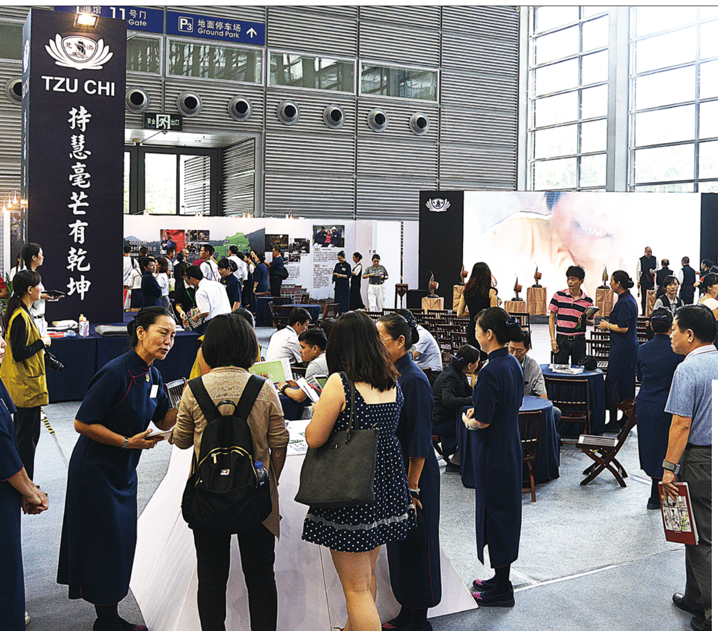
慈济参加第五届深圳慈善展，慈济展区位于一号馆。