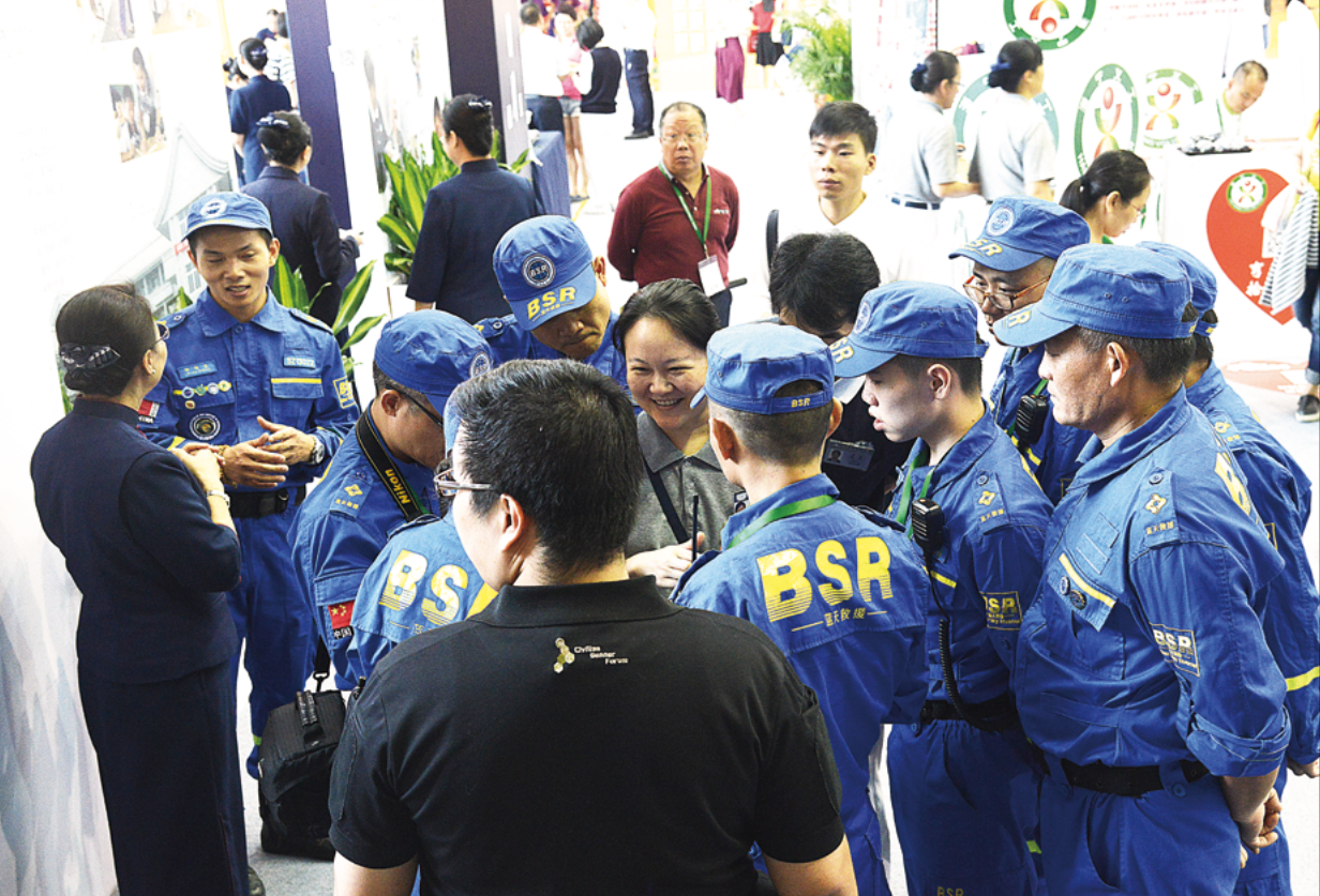
蓝天救援队专程来慈济展区观看学习，了解慈济的历史。

书长。今天不期而遇的这份欢喜，正是源于过去结下的友谊。多年来，慈济志工深入贵州偏乡，为失学的孩子援建学校，提供助学金，在麻山上的辍学孩子得以重拾书本，珍惜宝贵求学机会，重新站在崭新的人生起跑点上，甚至与政府合作移民迁村，改变了一代人的命运。