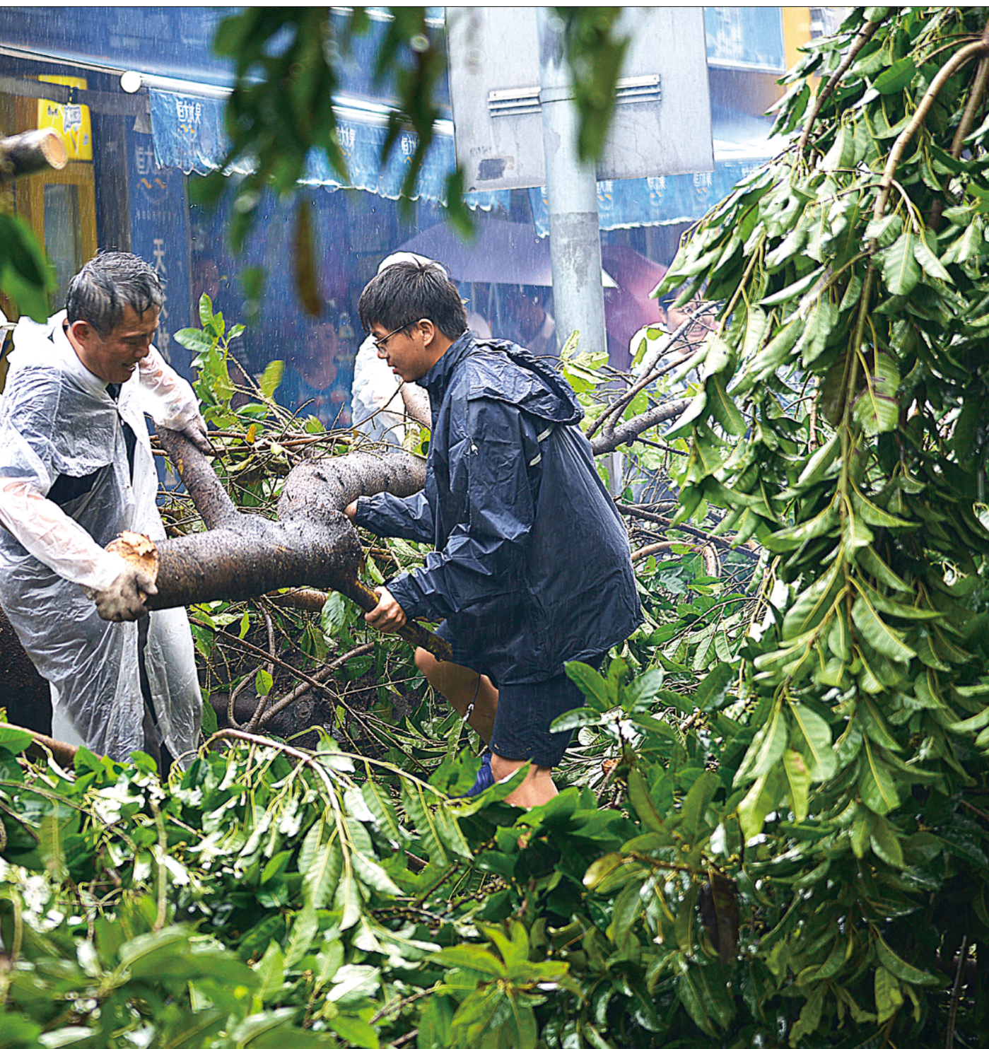
厦门慈济志工为了防止落木掉落砸到路人，砍断被风刮断的树枝，清理城市路面被台风损坏的树木。