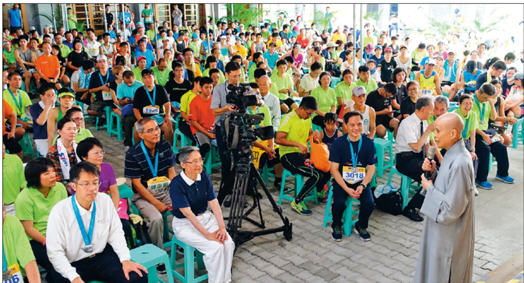
▲花莲慈院三十周年路跑健走活动，上人感恩医护同仁守护生命，成就慈院担负东部医疗的责任。

“五岁稚子能立志吃素、一路坚持，但愿大人们也能坚持下去。莫因欲念而消磨了志气，调伏