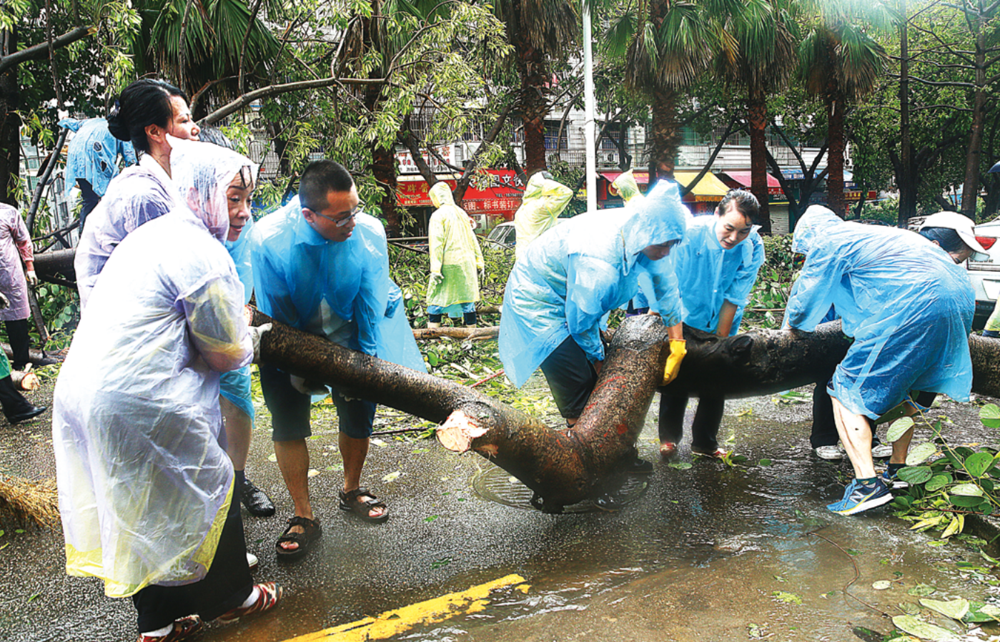
各地慈济志工齐聚，身体力行付出，让美丽的厦门迅速恢复原来的面貌，同时也激发人人心中爱的能量。

区打扫。接下来几天还需要慈济人的协助，一起来面对小区重建，让孩子们能在中秋后顺利回到校园上课。”谢美端感激道。