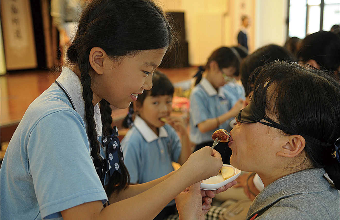
北京静思语亲子活动中，慈小班小朋友和妈妈一起分享小点心，把美食亲自喂到妈妈口中。