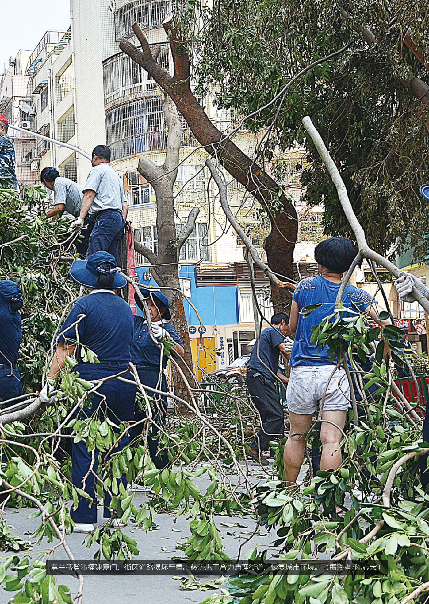
莫兰蒂登陆福建厦门，街区道路损坏严重。慈济志工合力清理街道，恢复城市环境。