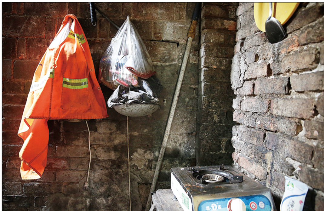
长沙开福区一普通环卫工人家中厨房一角，环境艰苦。