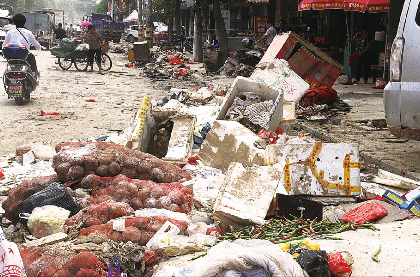
灾后的镇区一片狼藉，杂物横穿，垃圾满地，恶臭难闻。