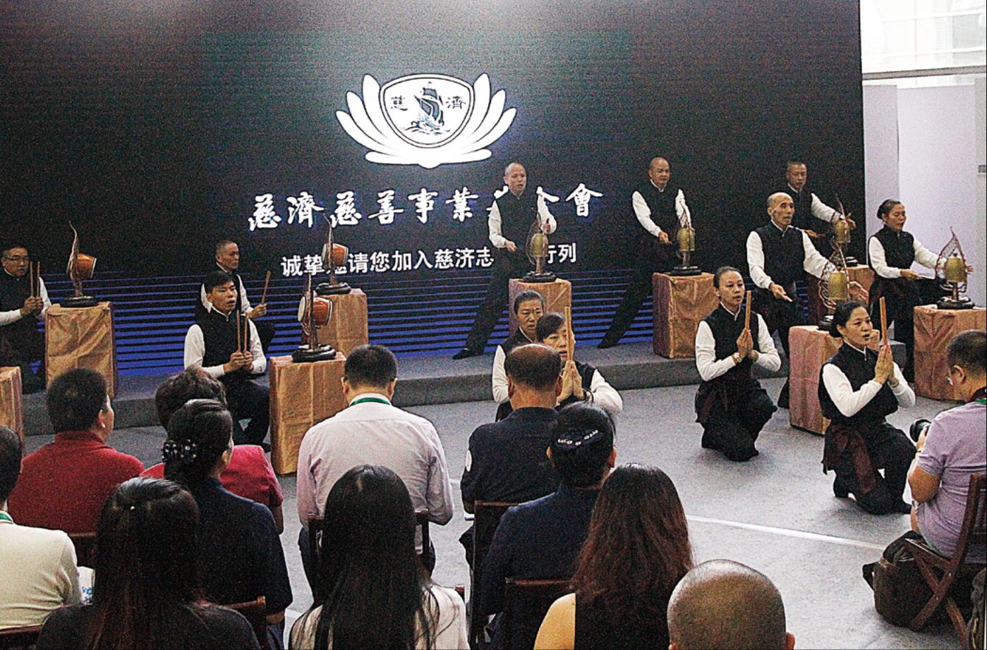
实业家与志工齐力演绎钟鼓齐鸣，敲醒善念，撼动人心。

轴，寓意每一束稻穗都是从一粒种子开始发芽结穗，只要启发人人一念善心，汇聚点滴爱心，化小爱为大爱，就能发挥“粒米成箩，滴水成河”的力量。