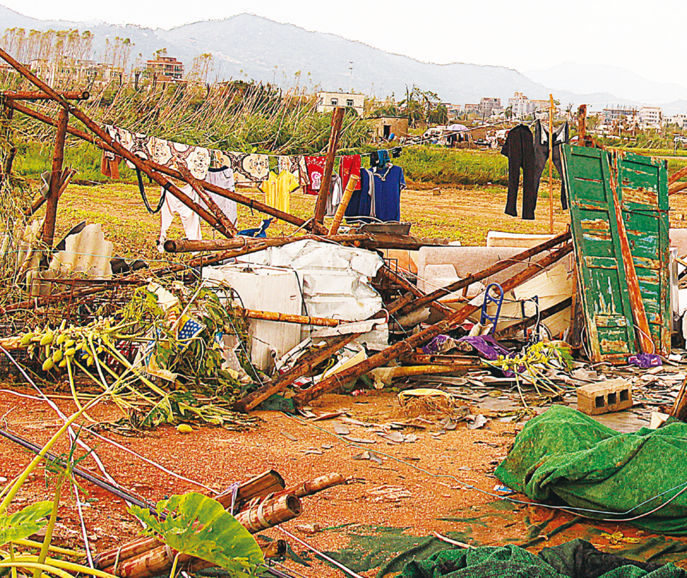
莫兰台风过后，只见地里除了有水，还有满地的破碎石棉瓦与杂物。

因为大面积停水停电，外来务农的乡亲吃饭成了问题。灾后第二天下午，林副镇长电话表达，灌口镇政府希望慈济可以协助关怀这些菜农。灾后第三天一早，三十一位慈济志工集合在厦门市灌口镇人民政府门口，分成两组分别去田头村和李林村进行了解。