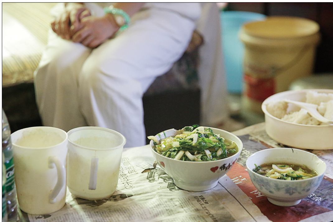
环卫工人们每天简单的一餐，青菜配米饭，有的甚至每日仅两餐，为了节约下钱能更好的照顾家人。