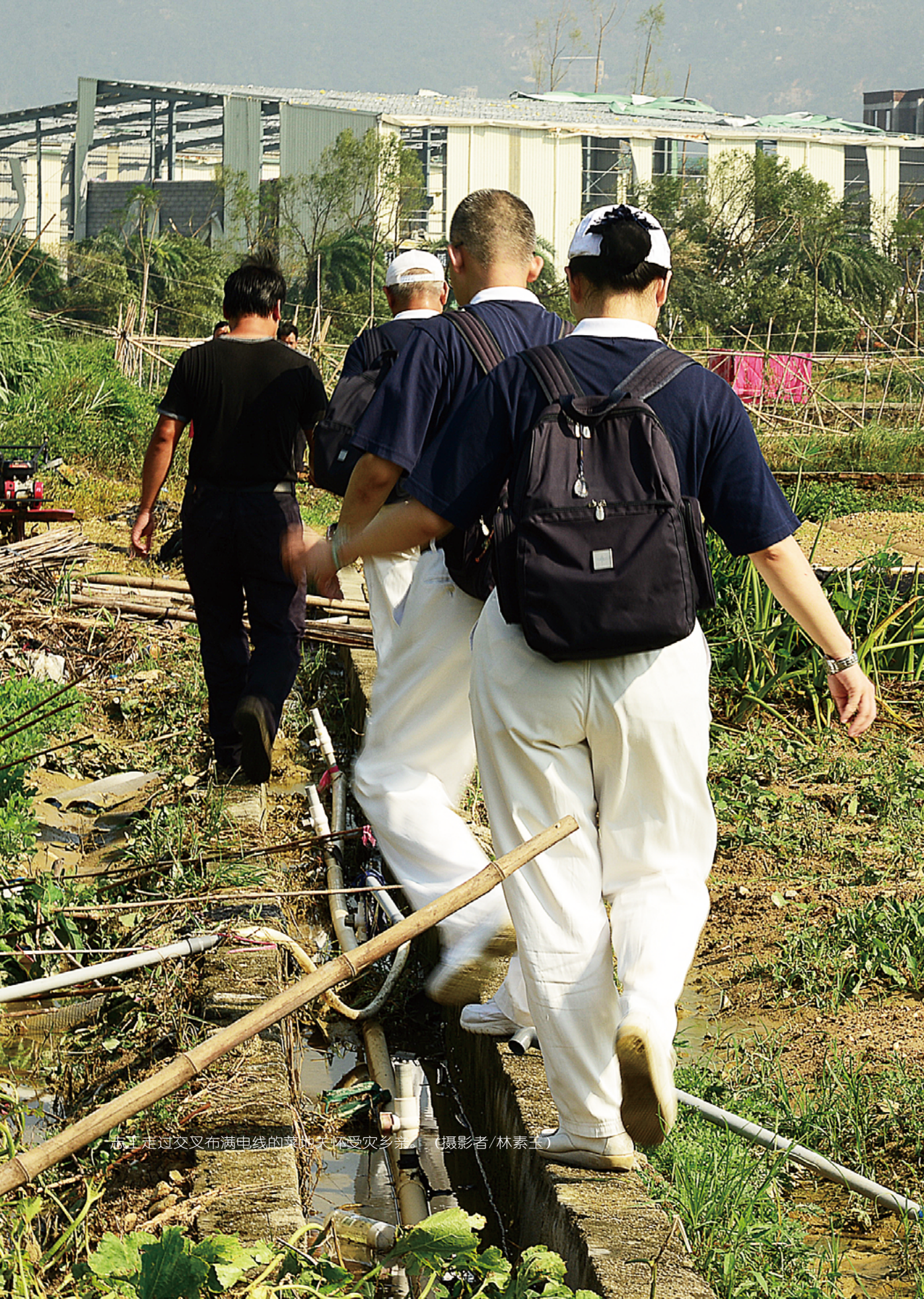
志工走过交叉布满电线的菜地关怀受灾乡亲。