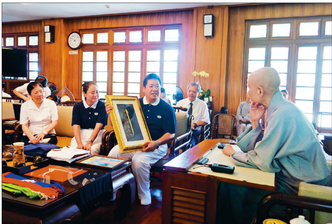
▲ 土耳其胡光中师兄（左三）呈苏丹加济市教育局长致赠的《可兰经》首章字母，上人表示：“万法归一，世间宗教的共同目标都是爱。”（8月22日）

虽然三界如火宅、人生多苦难，上人强调“法水”可以灭火。“人间祥和的关键在于人心。人人接受法水洗涤，启发无私大爱，心境就能变得祥和有爱，人间也会变得可爱。”