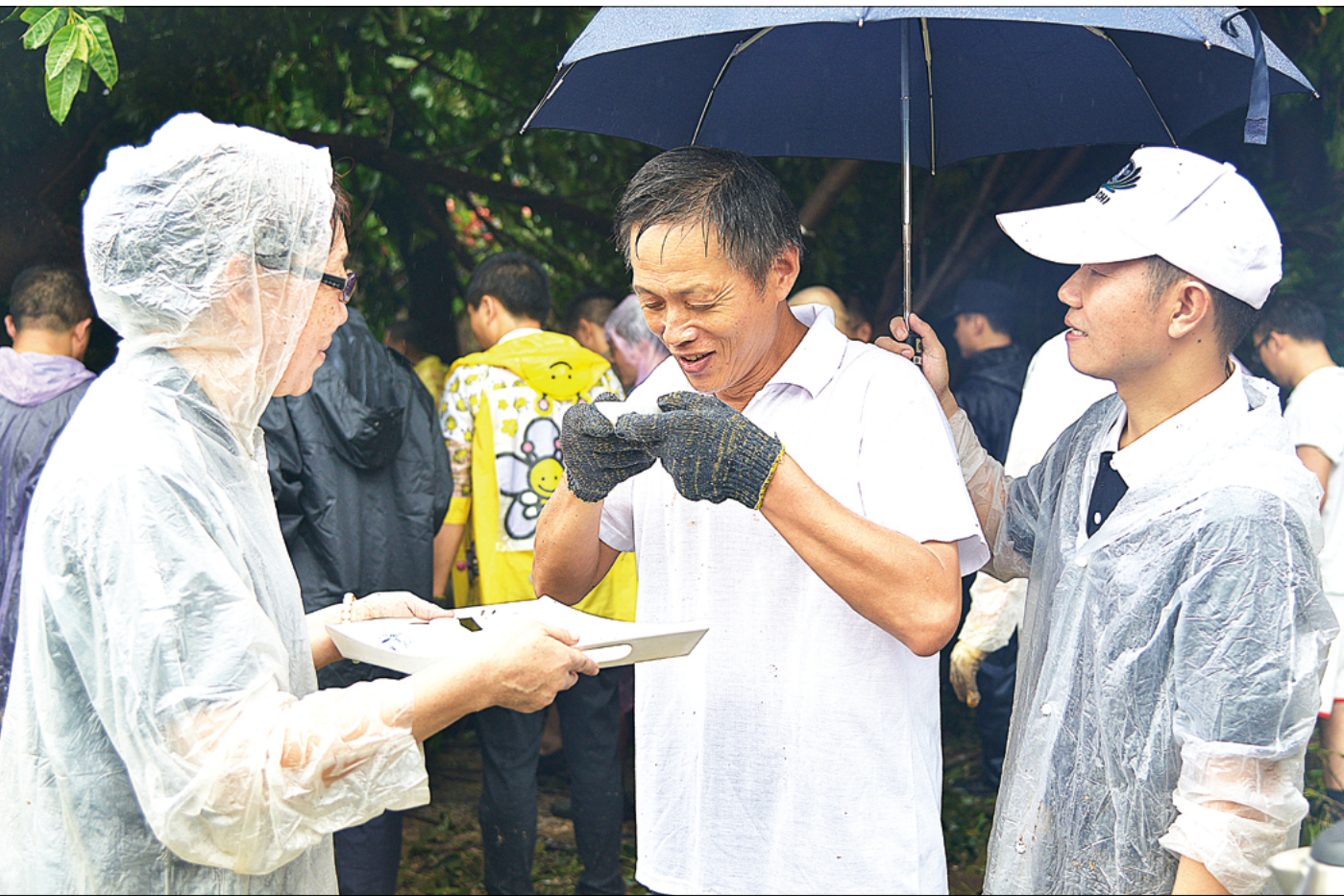
志工把热茶与饼干送到大家手中，在雨中送出温暖。

许多较早的小区，大街小巷纵横交错，许多楼房没有专业的物业管理，为小区居委会开展工作带来一定的障碍。