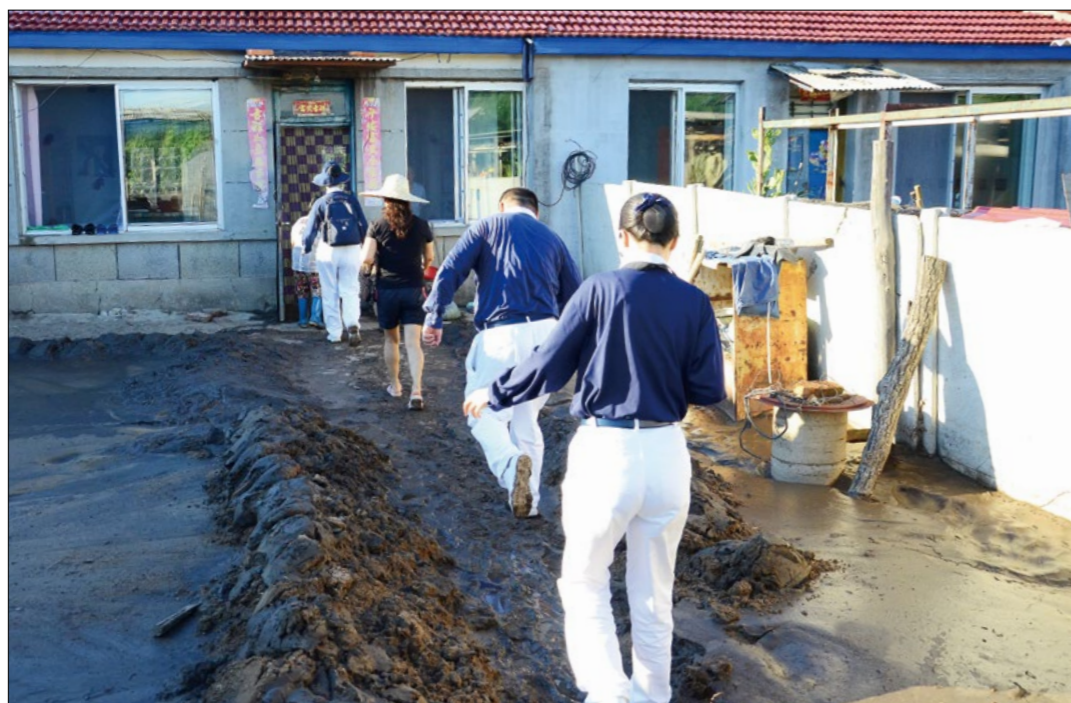
志工挨家挨户送上紧急援助物资以及来自全球慈济人的祝福。

此次吉林市受灾，慈济发放生活包、医药包、毛毯、香积饭、福慧床等物资，动员志工九百多人次，关怀民众一千八百多人次。苦难在哪里，慈济人的脚步就走到哪里，及时勘察灾情，展开救援，以诚与情付出，不只救灾，更募集人人的善念与虔诚，帮助灾民度过难关。❶