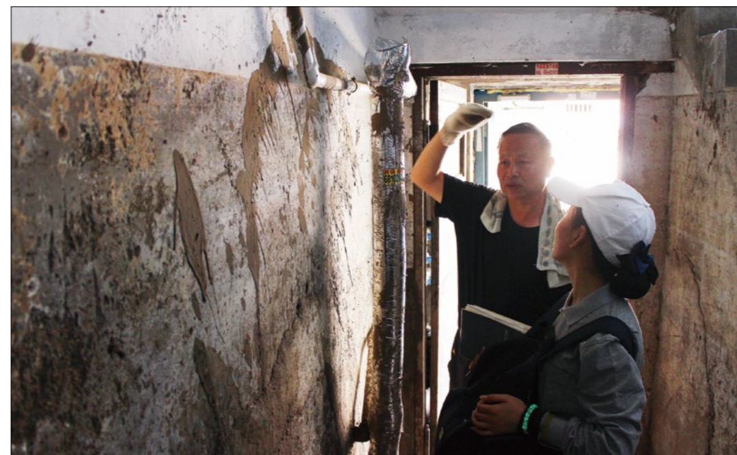
(左图) 洪水造成永吉县满目疮痍。 (上图) 墙上的痕迹反映当时洪水的高度。