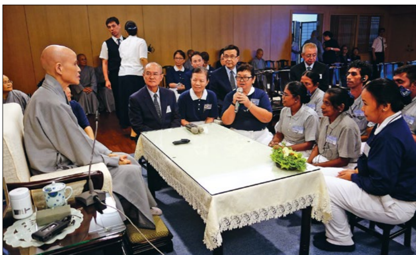
◀ 上人与来台参加营队的斯里兰卡与新加坡志工座谈。(6月19日)