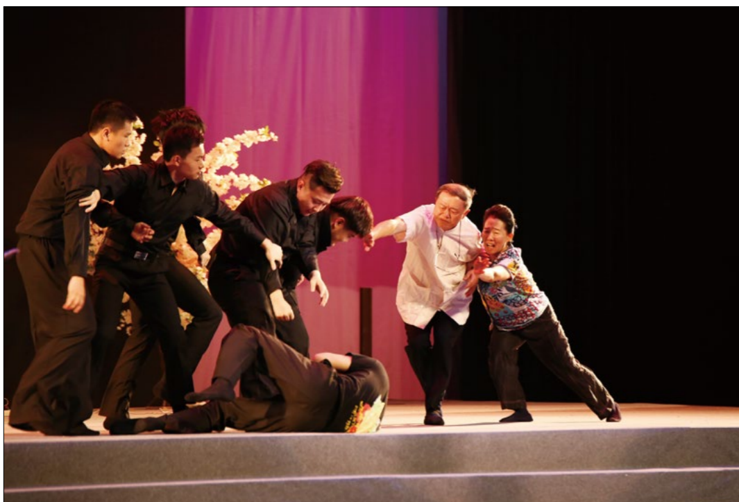
从“怀胎守护”至“究竟怜悯”，父母十恩，一幕幕如梦似真的演绎，感人至深。

济结缘，因为慈济放弃了去美国留学选择留在香港就读，因而有时间陪伴在家人身边，让生病的奶奶有了正确的治疗，进而减少了一些误查和病痛。有智慧的丹丹，知道父母长辈担心素食会对身体不好，懂得以专业的知识和父母用心沟通，每天亲自做素食，现在一年多了，父母不但接受了丹丹吃素，也慢慢开始接触蔬食。