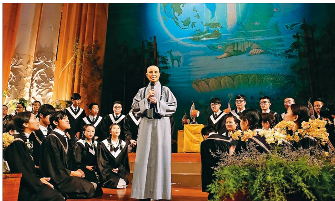
▼慈济科技大学毕业典礼，上人致勉毕业同学自爱爱人，时间能成就一切。（6月5日）

此非常时期，要作“不请之师”，主动询问是否需要帮忙、立即伸出援手。不要固守在自己的区域，也