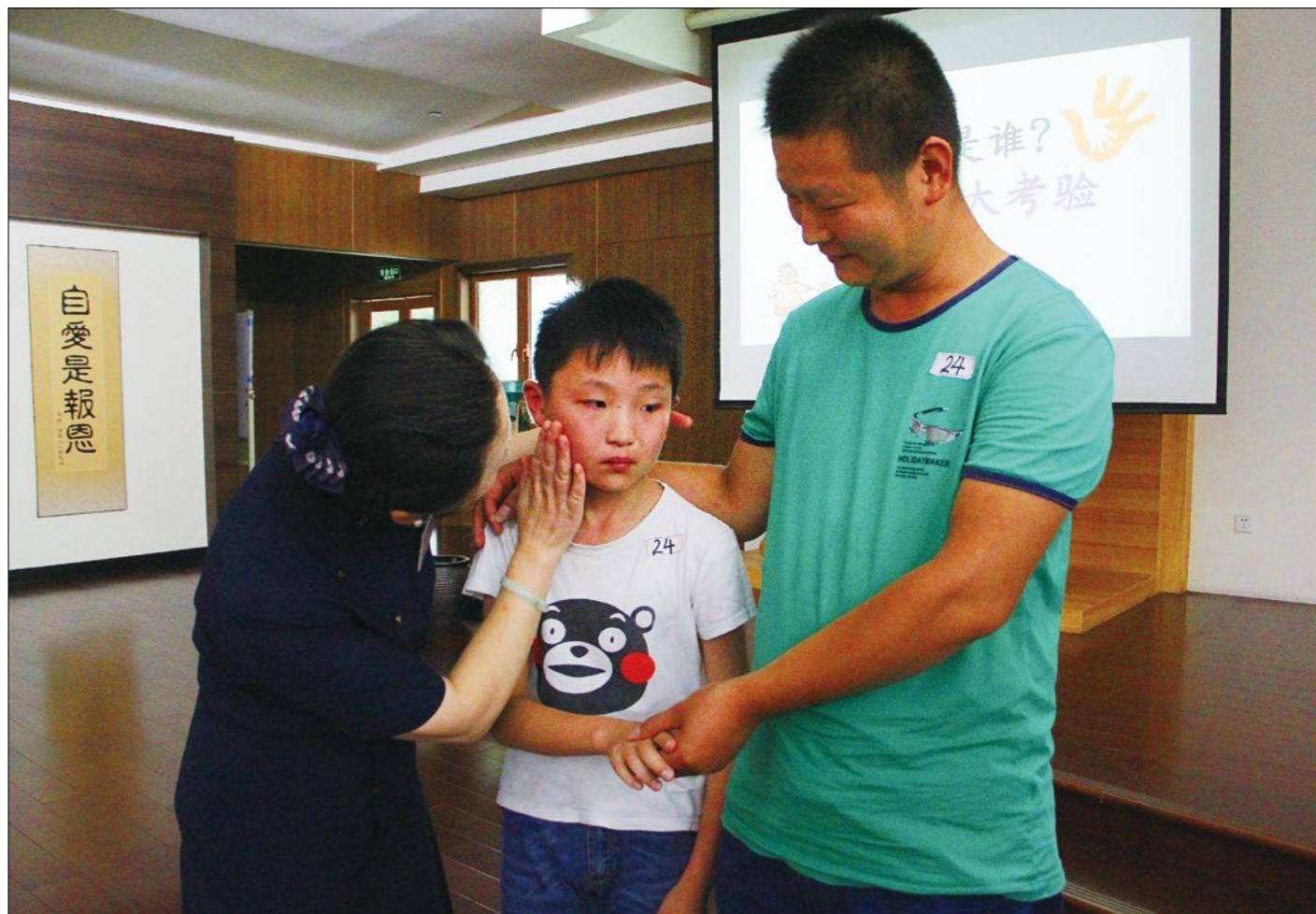
因为没有在游戏中成功认出爸爸的手，丰源十分难过，志工连忙轻声抚慰。