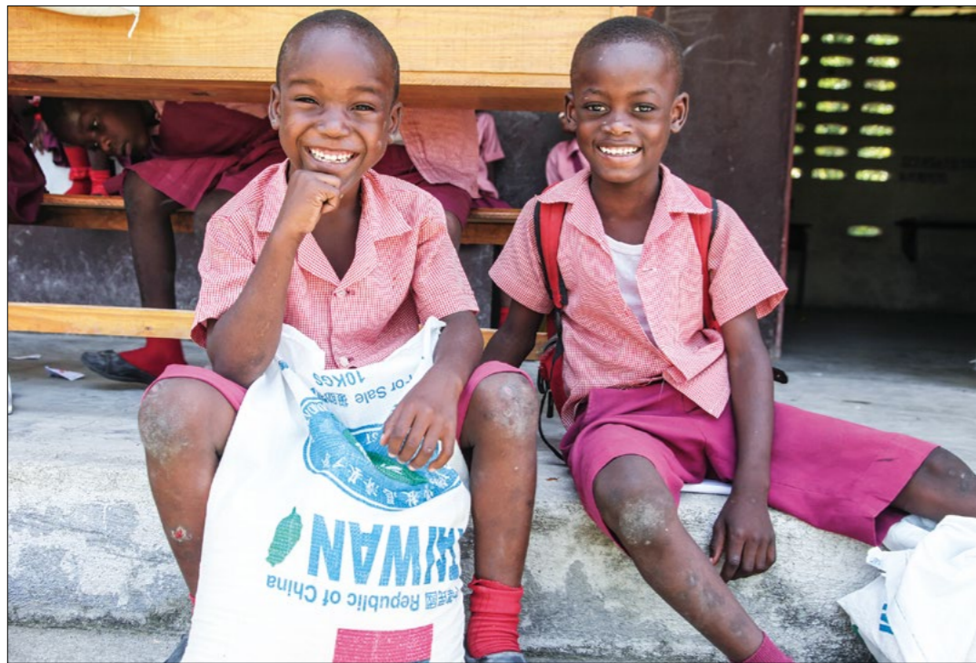
▲美国慈济志工六月中旬在海地发放，致赠贫困户三百吨白米及由多米尼加鞋商捐赠的一万双鞋子；上人于十六日志工早会分享居民欢喜心情，也致勉众人知福惜福。