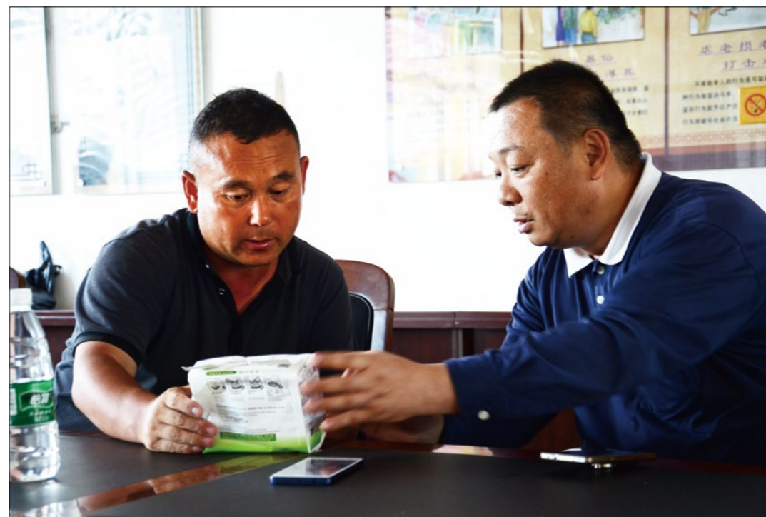
志工向受灾村镇干部介绍简单易用的香积饭，可供受灾乡亲救急食用。

笑逐颜开。志工看到周大姐把房间收拾得很干净，不仅鼓掌赞叹她的勤劳坚强。志工一身“蓝天白云”在泥泞中分外抢眼，亲切的问候和阵阵笑声更吸引村民纷纷围过来。