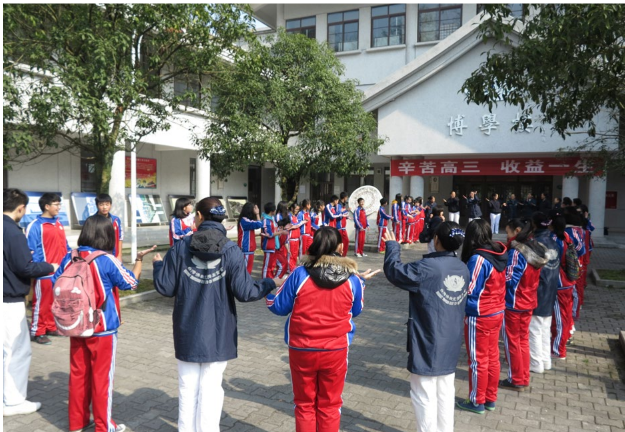
撰文/边静 张永