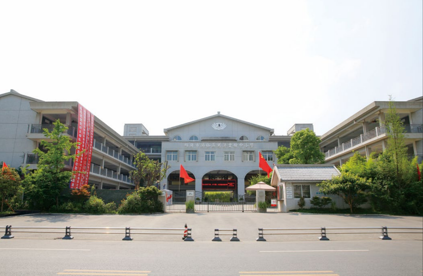
四川省绵阳市游仙慈济实验学校。

由一所普通学校变成绵阳市初中部最出名的名校，吸引了绵阳市及四川其他非招生片区的家长学生慕名而来，现在全校有三千六百多位学生。