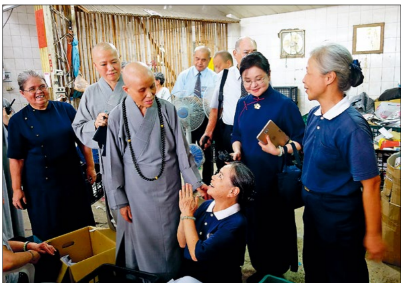
◀上人探视内湖环保站，感恩志工们在闷热的天气依然日日付出，磨练心力与耐力。 (6月26日)

实社区，让民众知道慈济人平常所做；或许还有许多人等着慈济人来接引，或是找不到进入慈济的门。慈济人有责任在社区里开一条路，