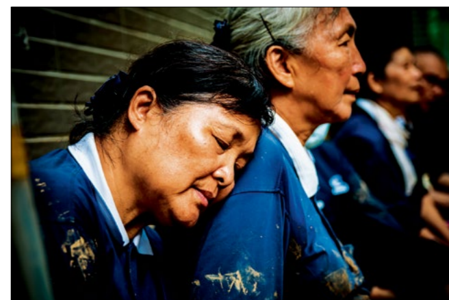
慈济志工协助受灾乡亲清扫家园，坚持助人心念，小歇一会儿再继续工作。上人不不舍弟子们负重身累，但也欣慰人人用心拔除世间苦难。