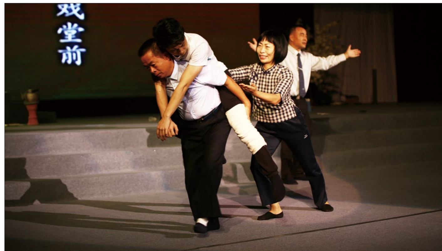
父母不论年纪多大，对子女的爱都是无怨无悔。