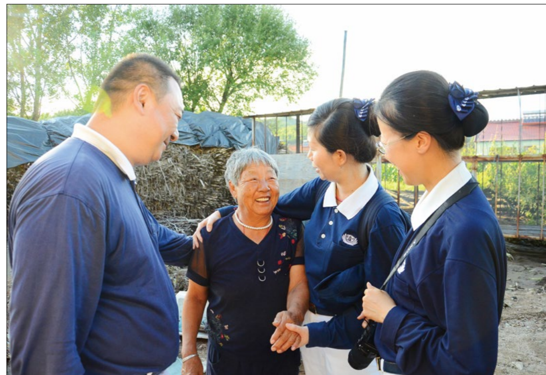
一个简单的拥抱，送上最真诚的祝福，志工给予乡亲重新站起来的力量。