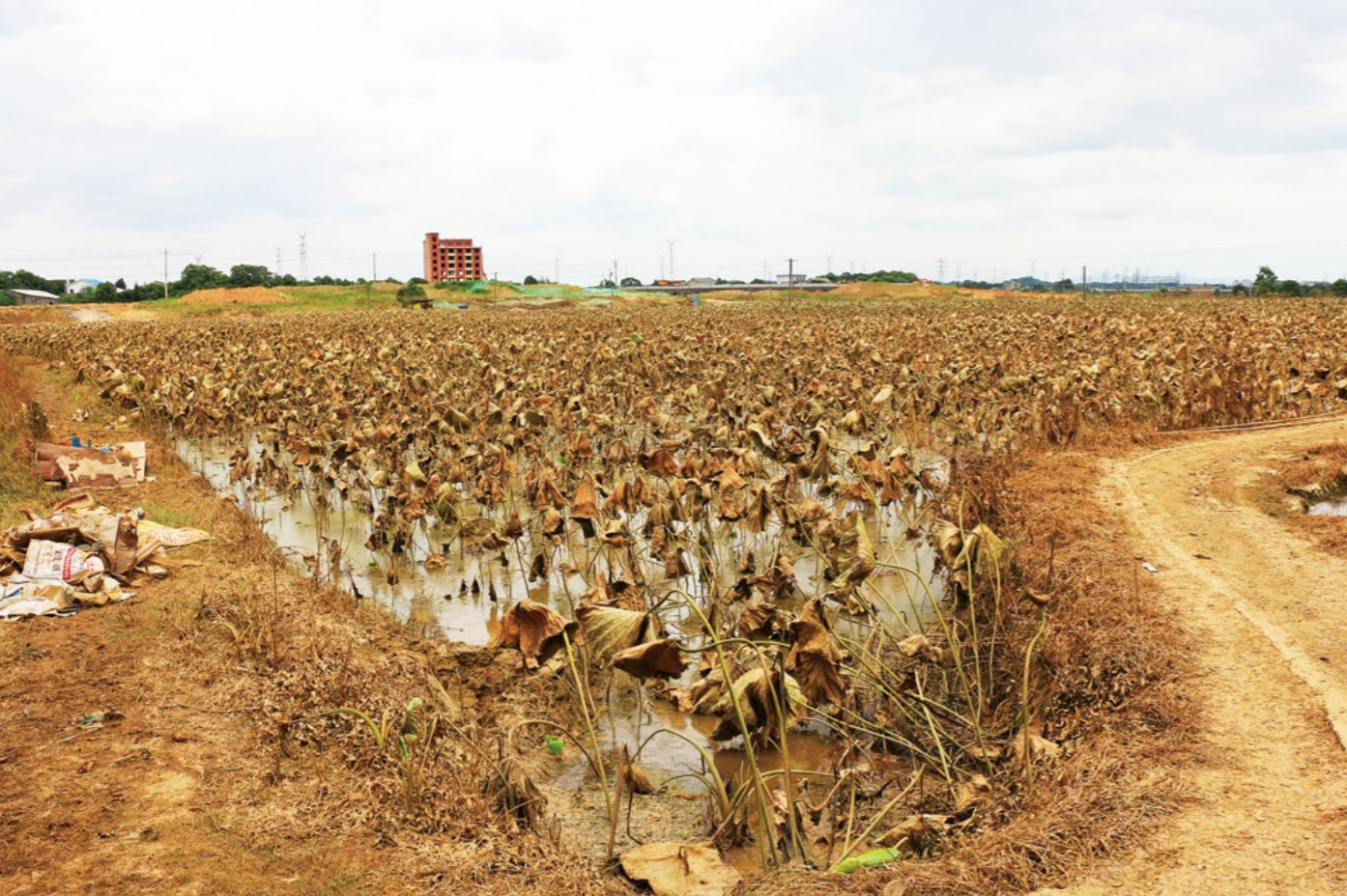
本来这两个月就是摘莲蓬的时候，大水一来损失惨重。

田地一冲而空，学校也停了课，接二连三的变动让小年纪的她一时无法接受。当慈济志工们带着预先准备好的救济物资送给小朋友时，孩子们都显得很快乐，围在志工们身边，陈思却一个人默默坐在一边。