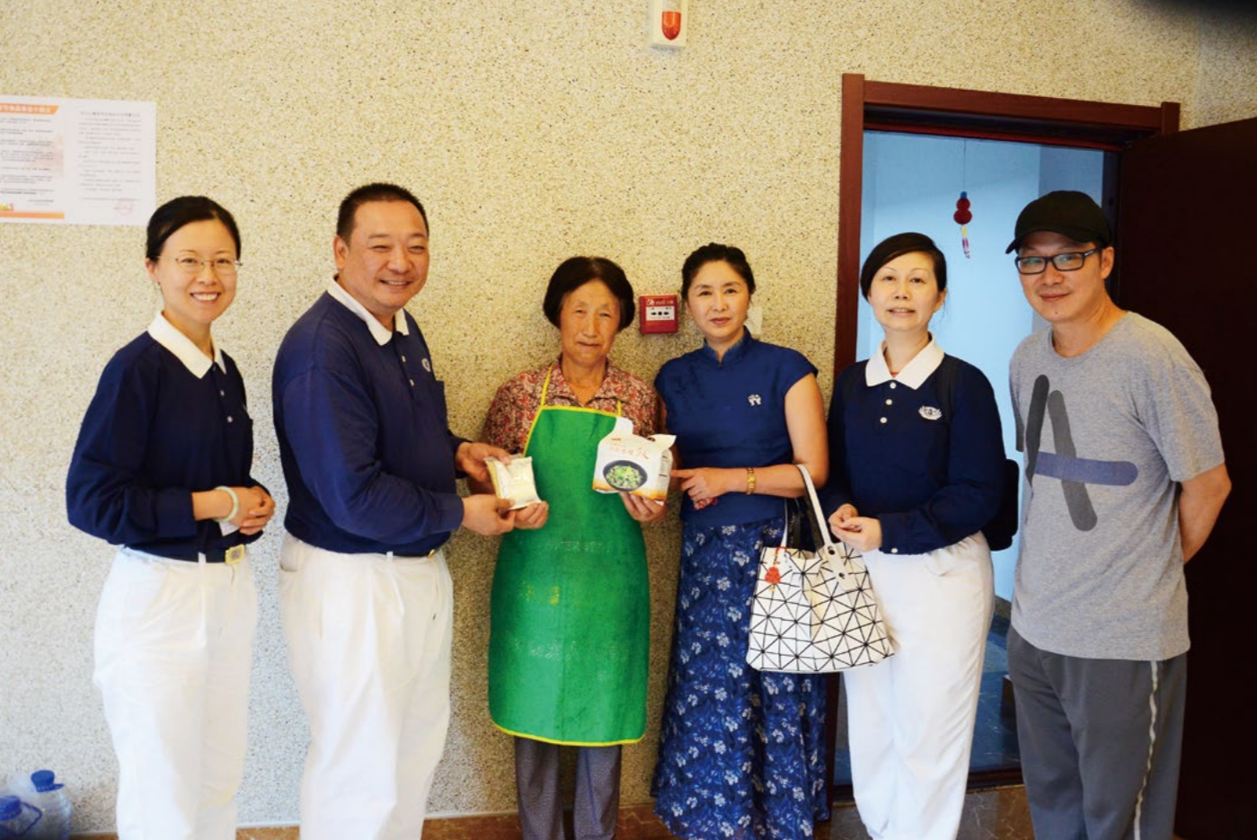
志工前往佛手山文化公园探望安置乡亲，提供香积饭供乡亲食用。