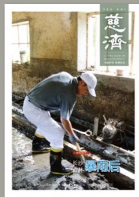
封面图说： 吉林暴雨造成洪灾，泥沙与土石冲入居民家中，志工不畏脏臭协助清扫。