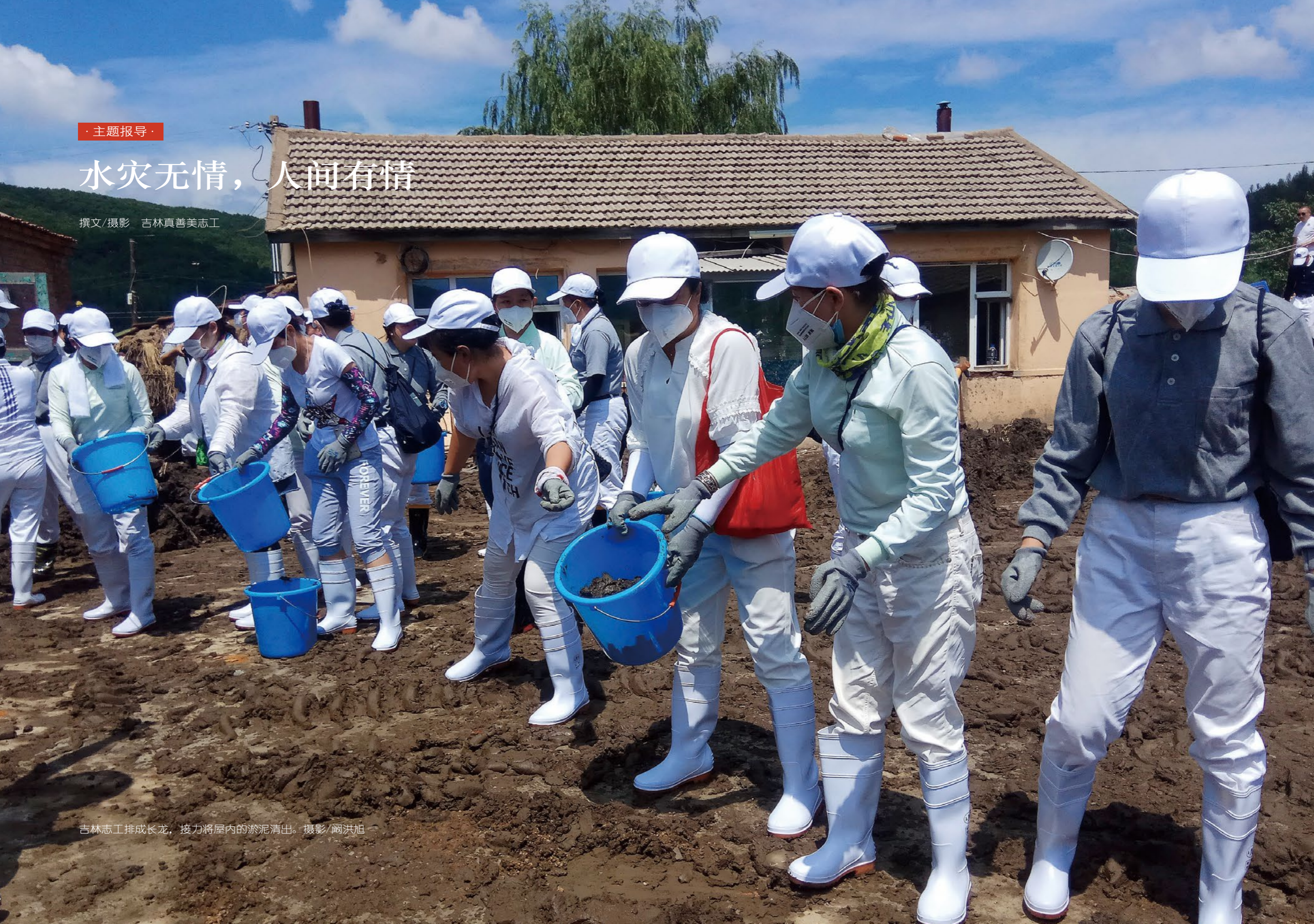
吉林志工排成长龙，接力将屋内的淤泥清出。