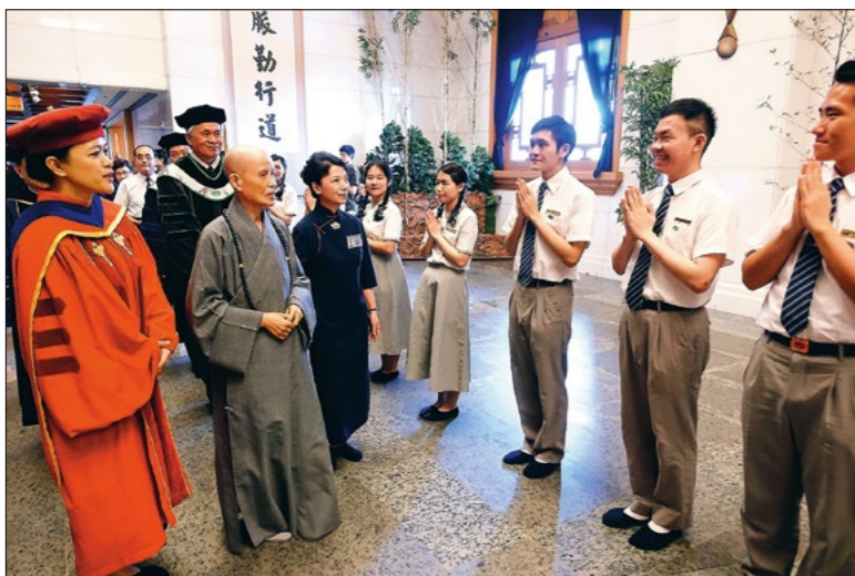
◀ 慈济大学第二十届毕业典礼，同学们恭迎上人与师长入场。上人期许同学们志在四方，步步踏实。（6月3日）