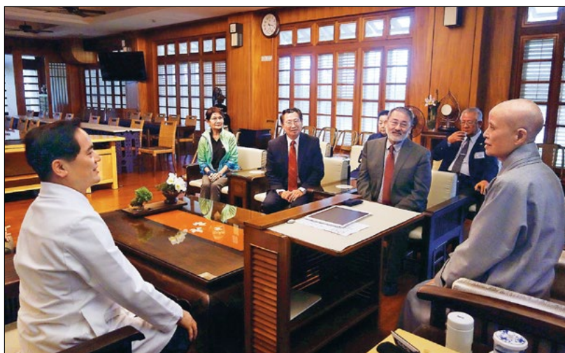
◀ 国际知名神经外科医师杨咏威（上图右一）来访，分享干细胞移植治疗脊髓损伤的研究成果；对于慈济医疗志工鼓励病人重燃生机的影响力，他表示深刻感动。（4月13日）