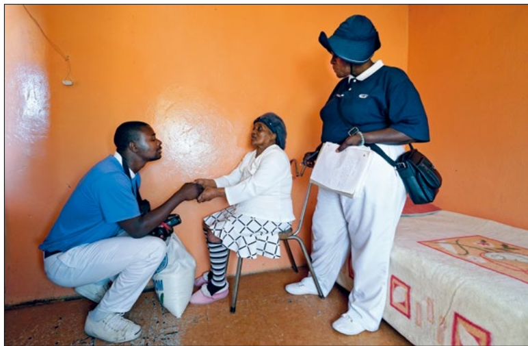
◀ 南非慈青关怀贫困户。台商慈济志工带动非洲志业，也启发年轻一辈本土志工投入慈善服务。

“为了受灾流离的居民，要自我勉励‘在苦难中长养慈悲’，无论面对什么声色，都要堪得忍耐。即使各方意见不同，依然坚持正向，‘在变数中考验智慧’；