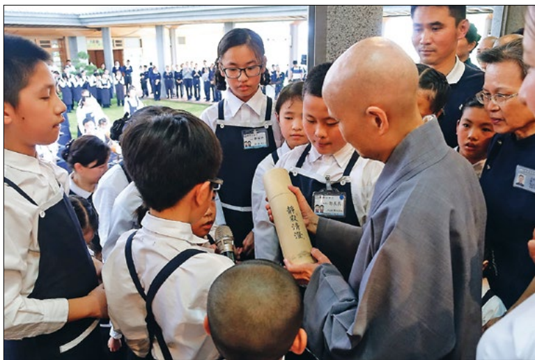
◀ 全台一百多位书轩小志工回精舍朝山，上人期勉维持清净心，培养善念，持续增长慧命。（4月16日）