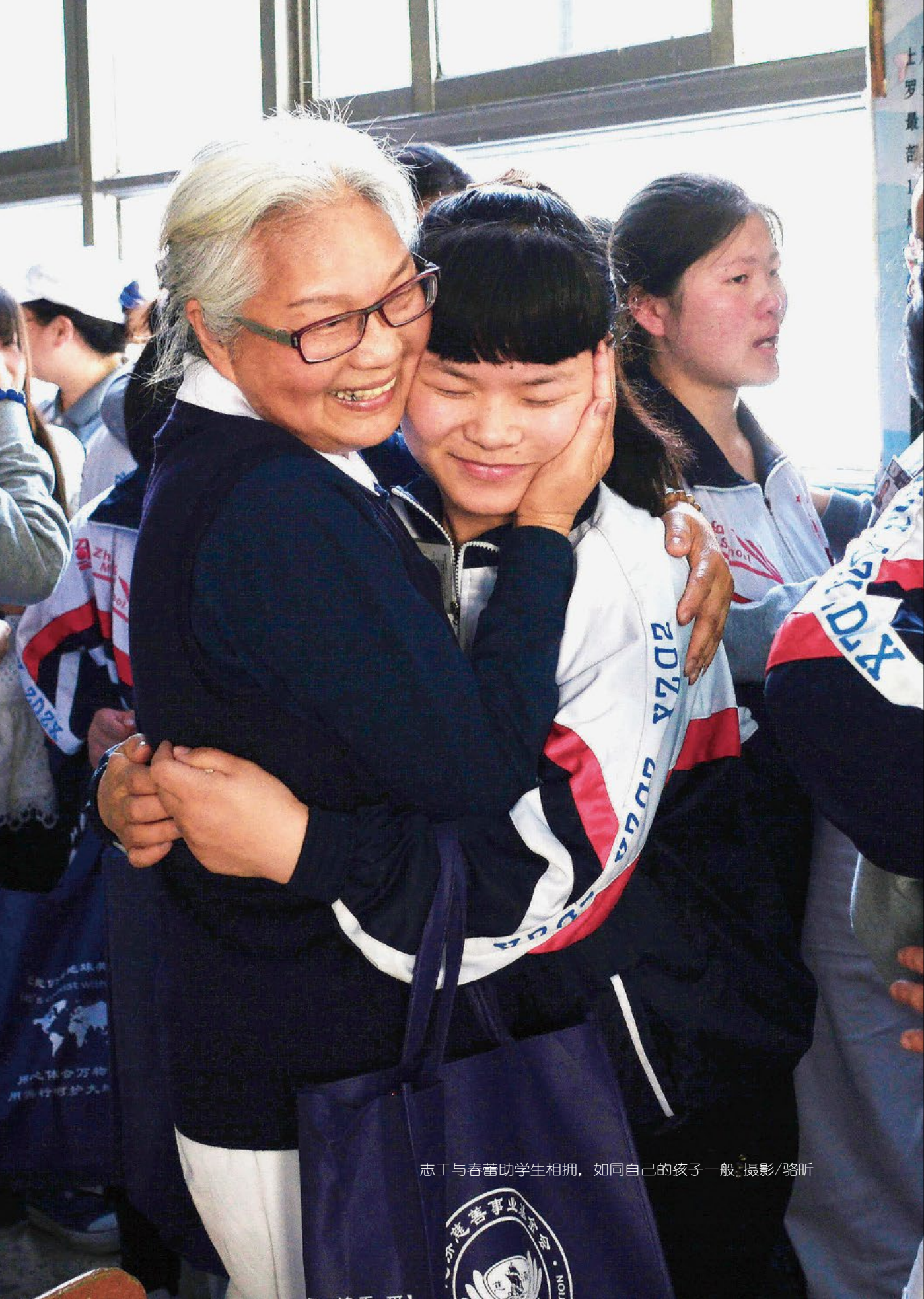
志工与春蕾助学生相拥，如同自己的孩子一般。