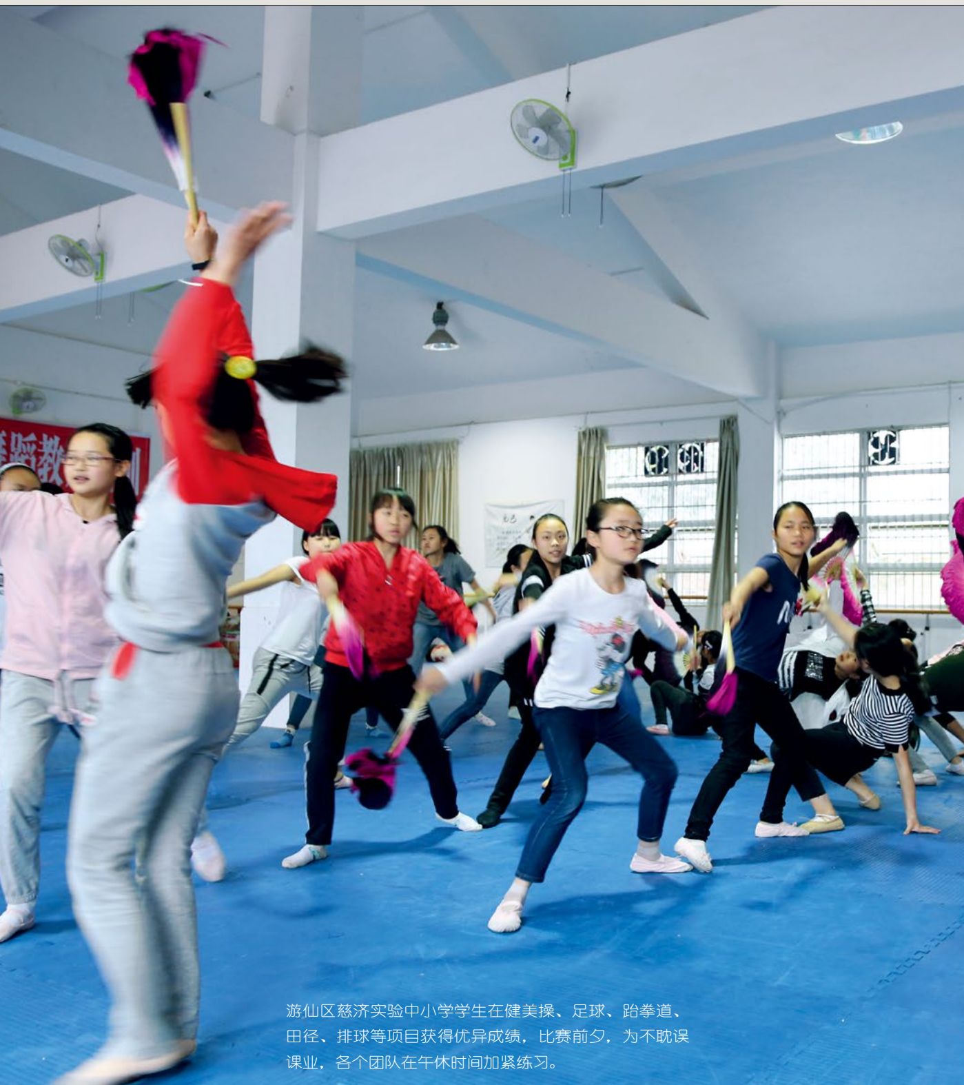
游仙区慈济实验中小学学生在健美操、足球、跆拳道、田径、排球等项目获得优异成绩，比赛前夕，为不耽误课业，各个团队在午休时间加紧练习。