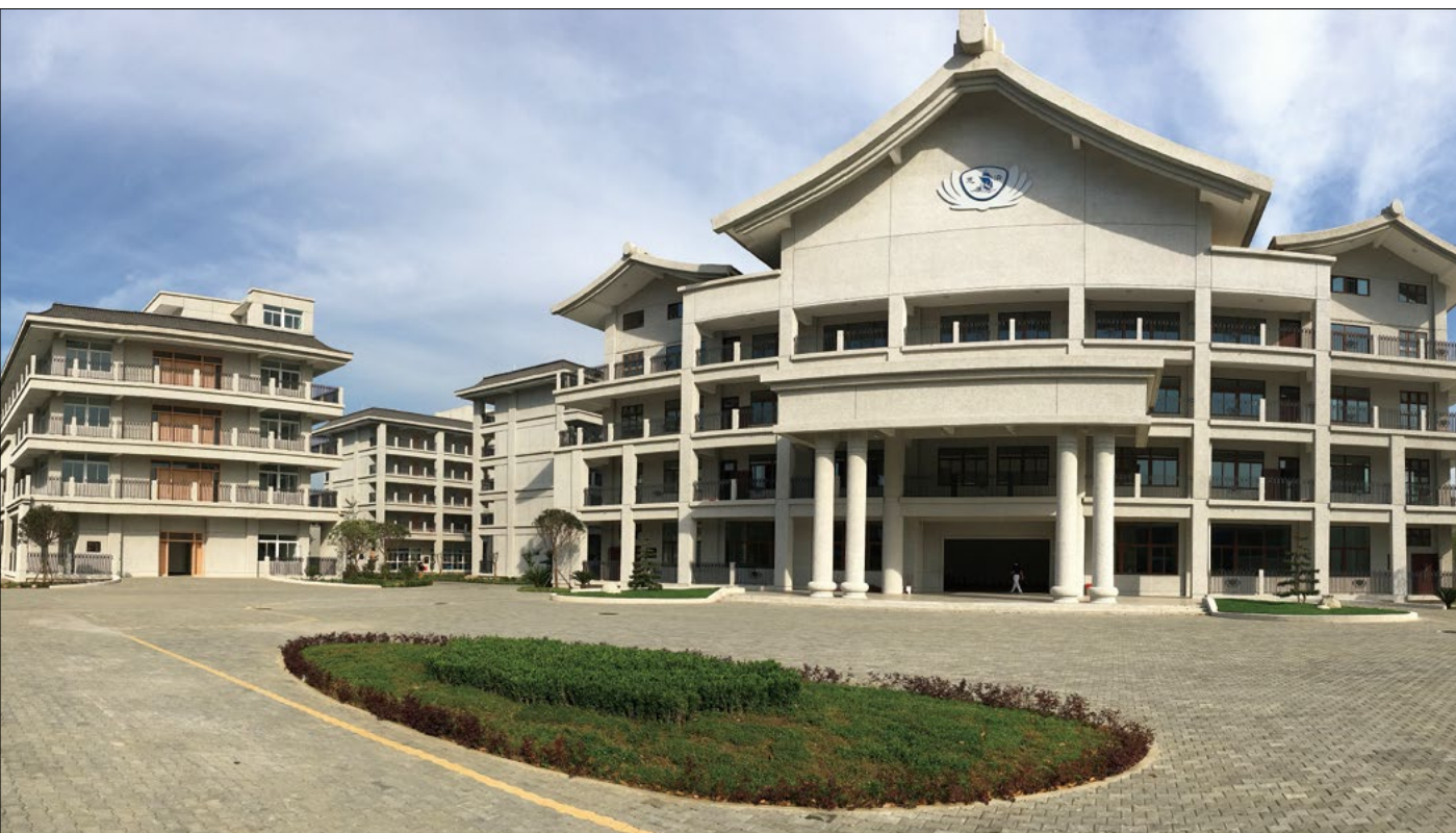
志工在成都大爱感恩科技环保园区举办为期两天的活动。

“慈济，让我找到了属于自己的心灵之路，为我打开了爱与感恩之门。我们会越走越远，会帮助更多的家人，相信有一天，世界将充满爱与和平。”