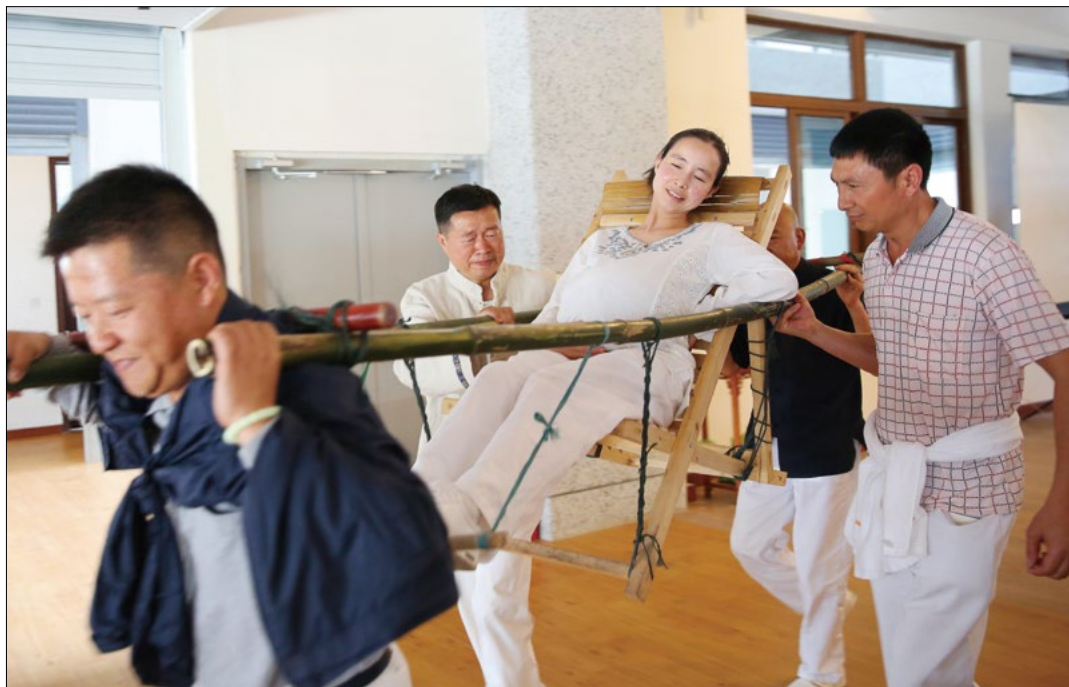
云南志工呈现小品，讲述当初证严上人开展医疗志业的初衷。

助，他们还一直来看我，跟我说话，是对我心灵上不断的帮助，我觉得很受鼓励。后来在哥哥带回家的慈济杂志上，我看到了师公上人的照片，哥哥说师公已经八十岁了，可我觉得，师公看上去好年轻。又在后来很多活动里知道了，慈济是从师公当年的一个小茅屋，发展到今天的静思堂的样子，觉得师公好了不起。我也要像师公和师姑师伯那样，做一些能够帮助别人的事。”