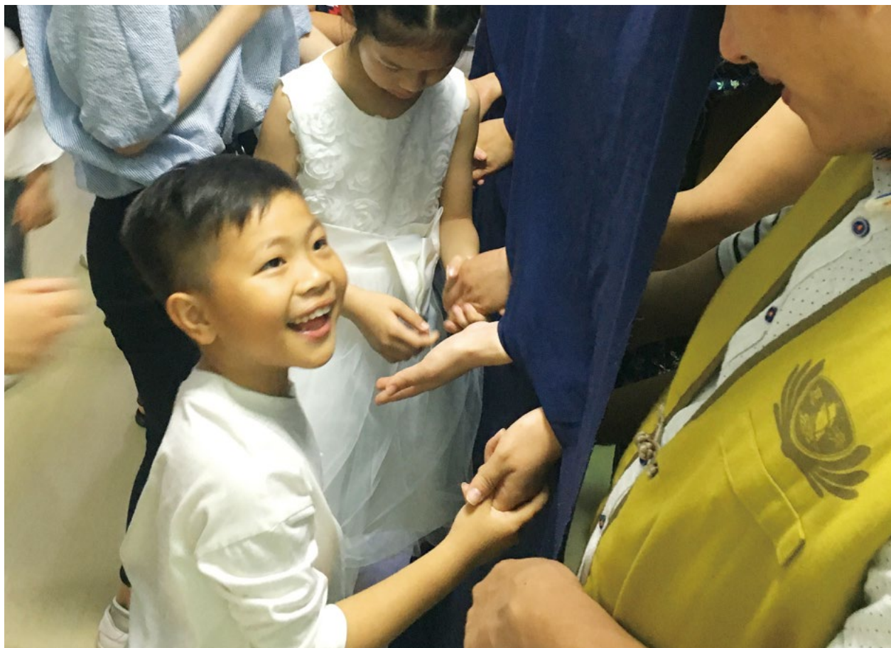
撰文/杨文娟 摄影/林芳