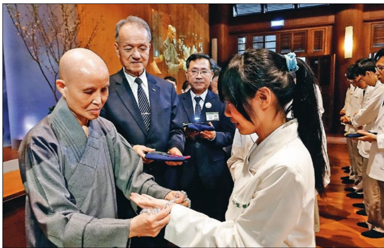
慈济大学学士后中医学系授袍典礼，上人勉众提起使命感，守住“医疗魂”，做医病更医心的好医师。（4月30日）