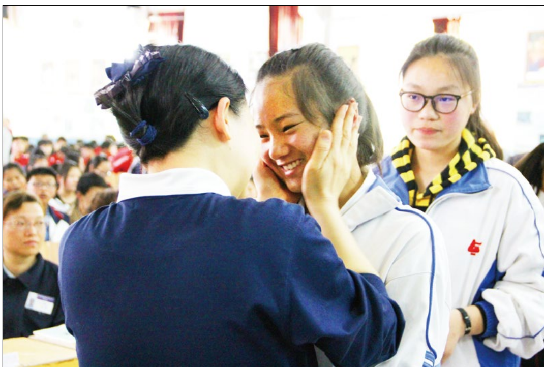
颁发助学金的同时，志工不忘给学生鼓励。