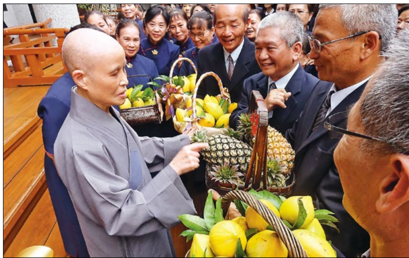
◀ 慈济五十一周年庆，海内外慈济人纷纷归返心灵故乡，嘉义慈济人向上人请安。 (4月20日)