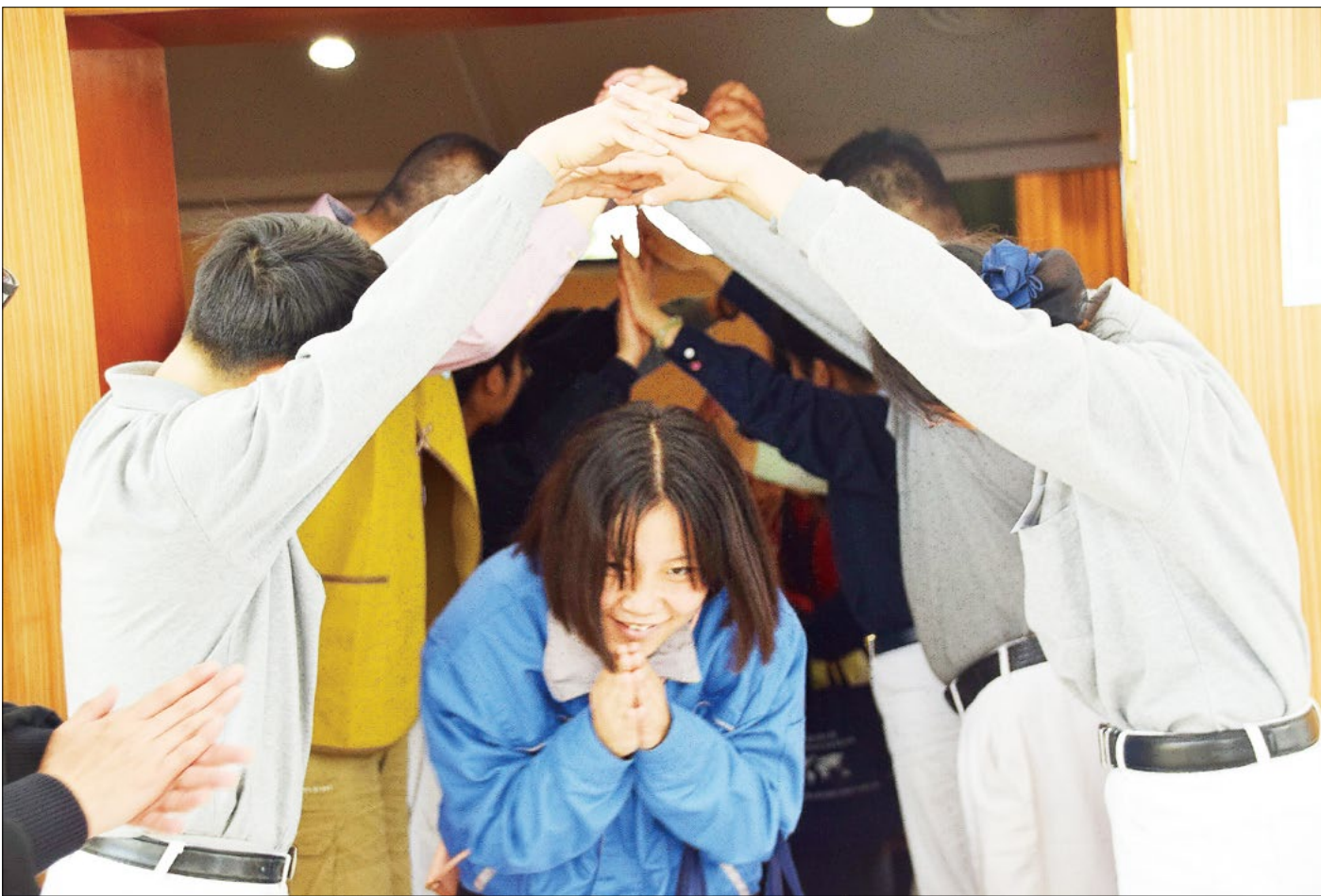
春蕾助学生从志工搭起的爱心桥下走出，收下满满的祝福。