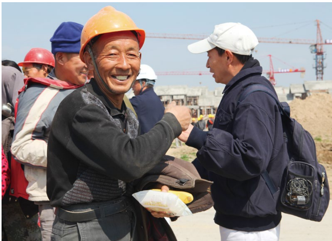
华东志工每周关怀为大爱村建设付出劳力的工地家人。

进工地，在志工弯腰恭敬地送上水果点心等慰问品时还有些疑虑，一个多月过去了，温暖的关怀如同春日的暖阳，软化了每个人的心。