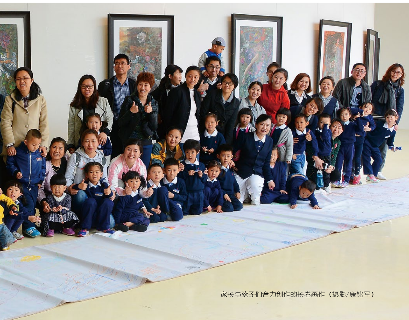
家长与孩子们合力创作的长卷画作