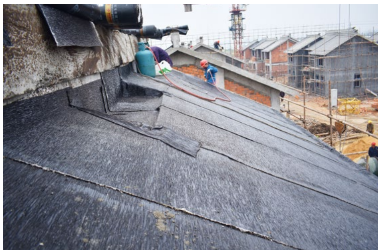
（左图）各栋斜屋面防水卷材与混凝土表面加热沾黏形成一体，可达到防水保温效果。