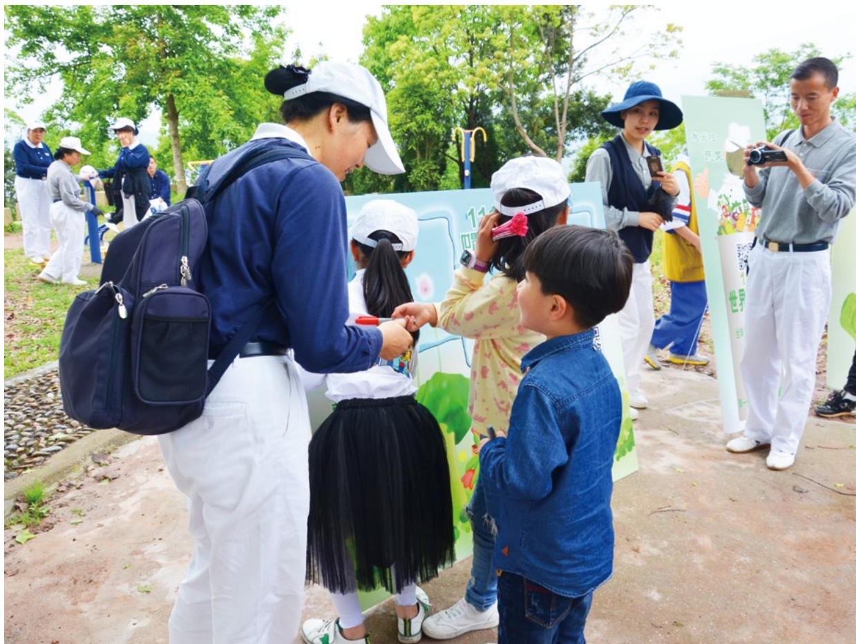
志工鼓励孩子们要多素食护地球，小小看板留下孩子们爱护地球的承诺。

圾下山，每个人脸上都洋溢着灿烂的笑容。环保队伍里还有好多家长带着孩子一起来的，大手牵小手，努力爱地球。