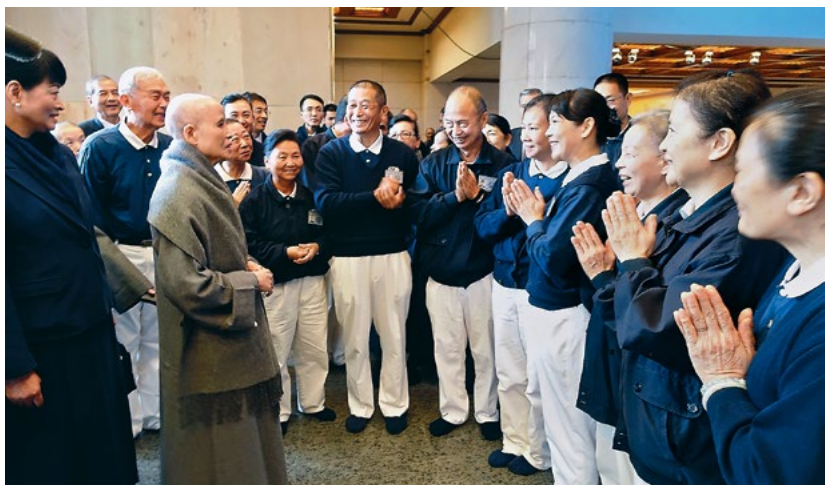
◀ 全球静思生活营圆缘，上人感恩各地志工前来支援营队事务，让参与者心无旁鹜学习。（3月26日）