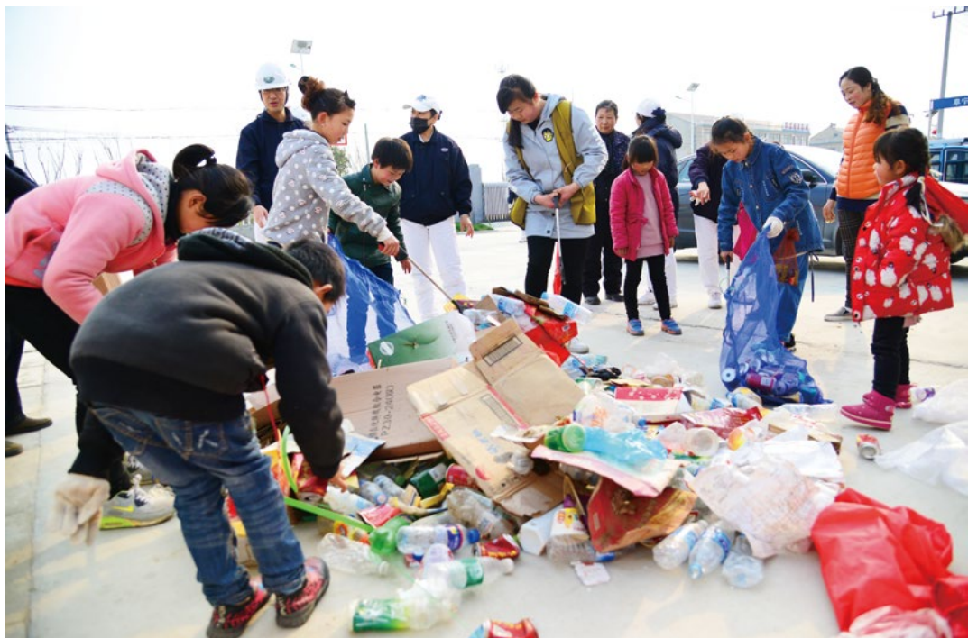
华东地区志工带动当地村民做资源回收分类。