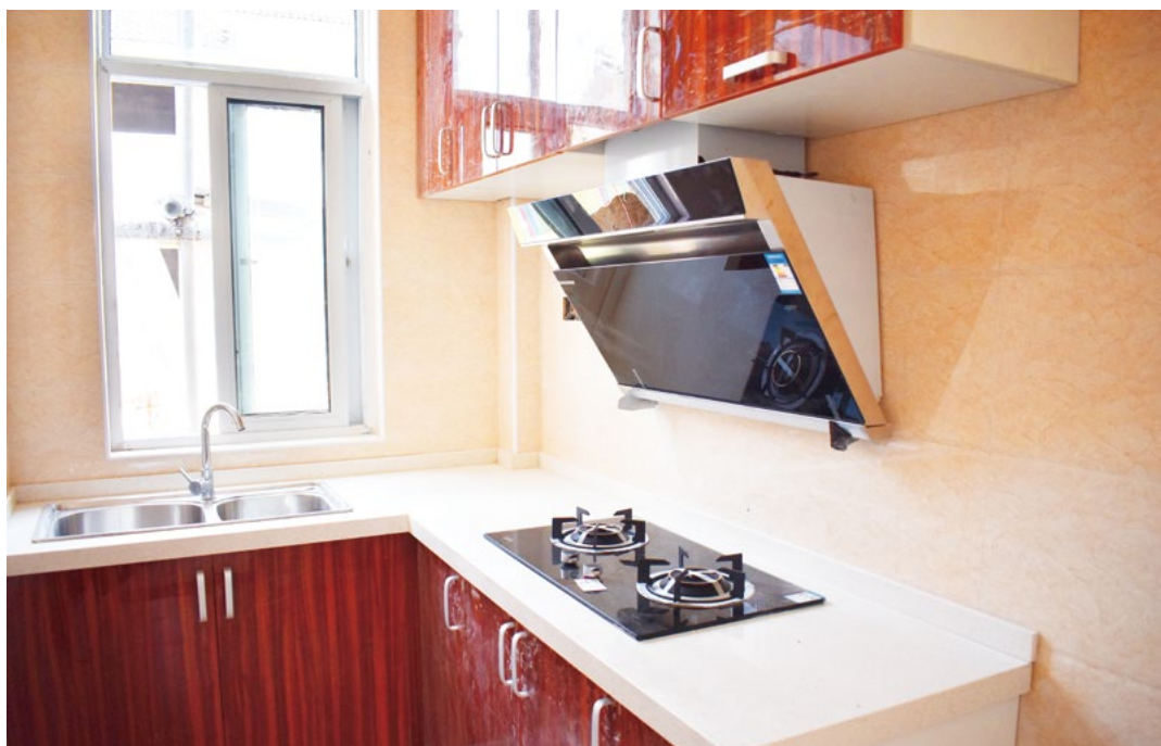
（下图）每栋房屋皆为精装修，厨房卫浴齐备，村民只需拎包入住。