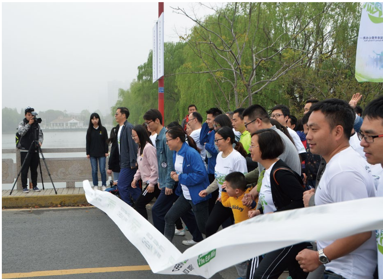
撰文/俞建宝