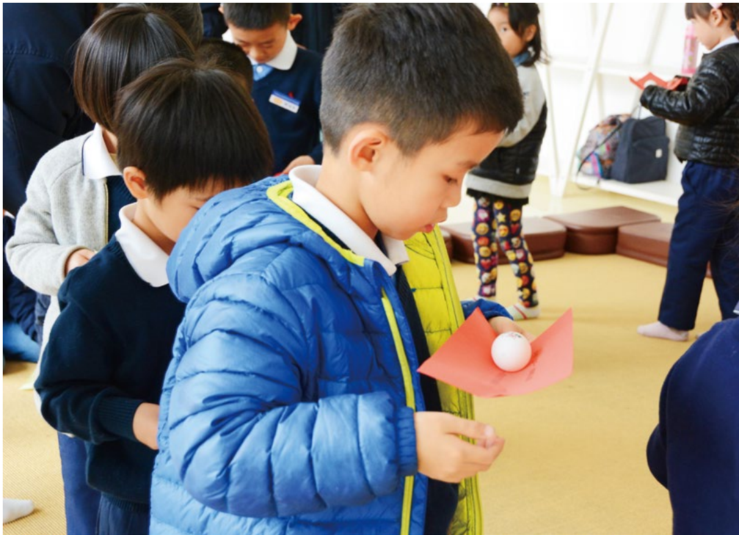
慈幼班小朋友托着小球慢慢走，原来只要专心，一样可以做到小球不掉下来。

从《夜奔》《拔树为禅》…到《生命之歌》等十二幅作品，许英辉老师都一一导览讲解。“这幅名字是《拔树为禅》，看画中这人