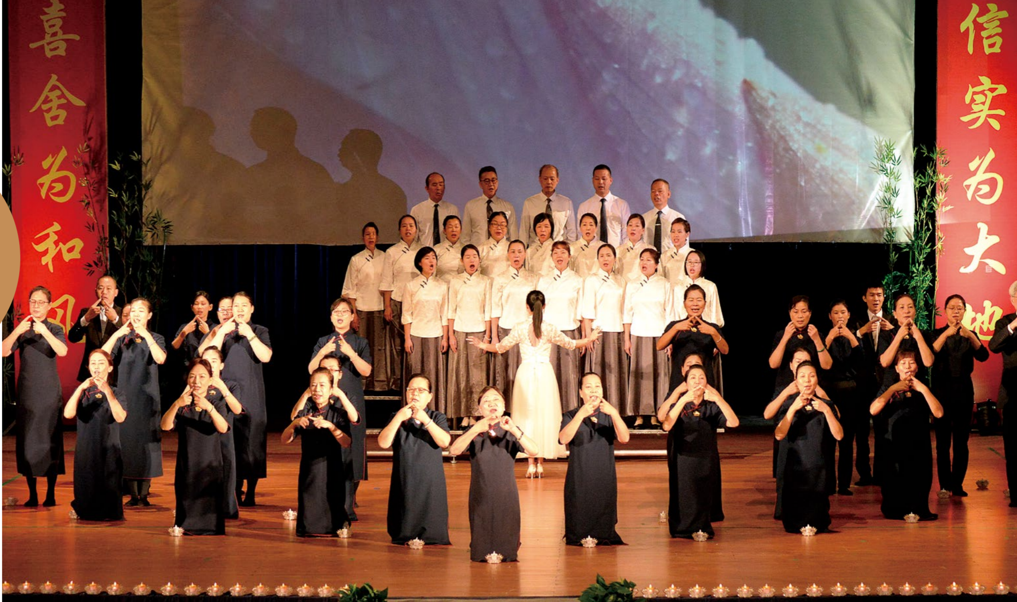
撰文/摄影 东莞真善美志工