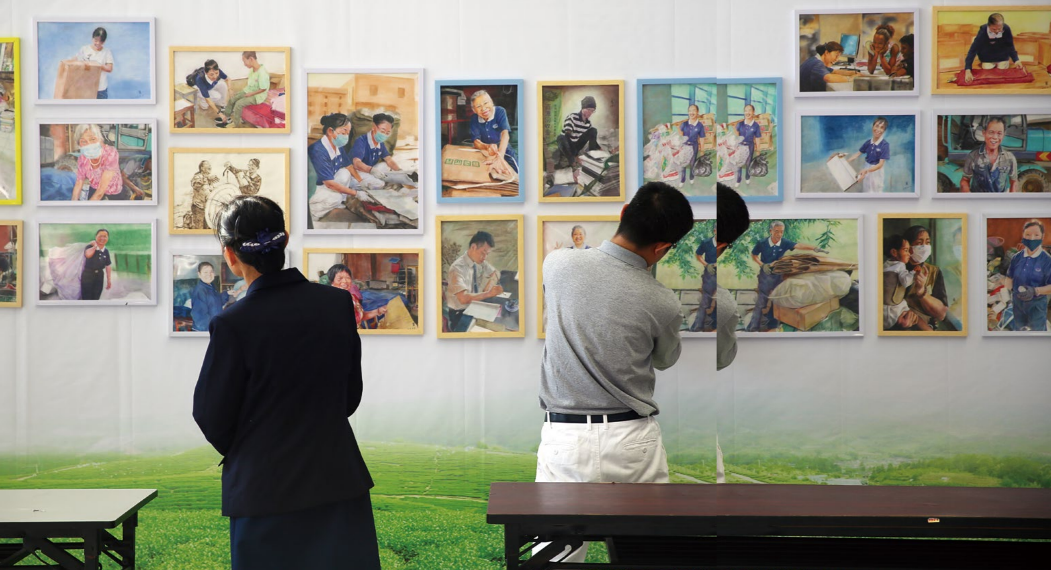
(左图) 墙上四十幅手绘志工肖像画, 呈现志工投入慈善或环保的身影。