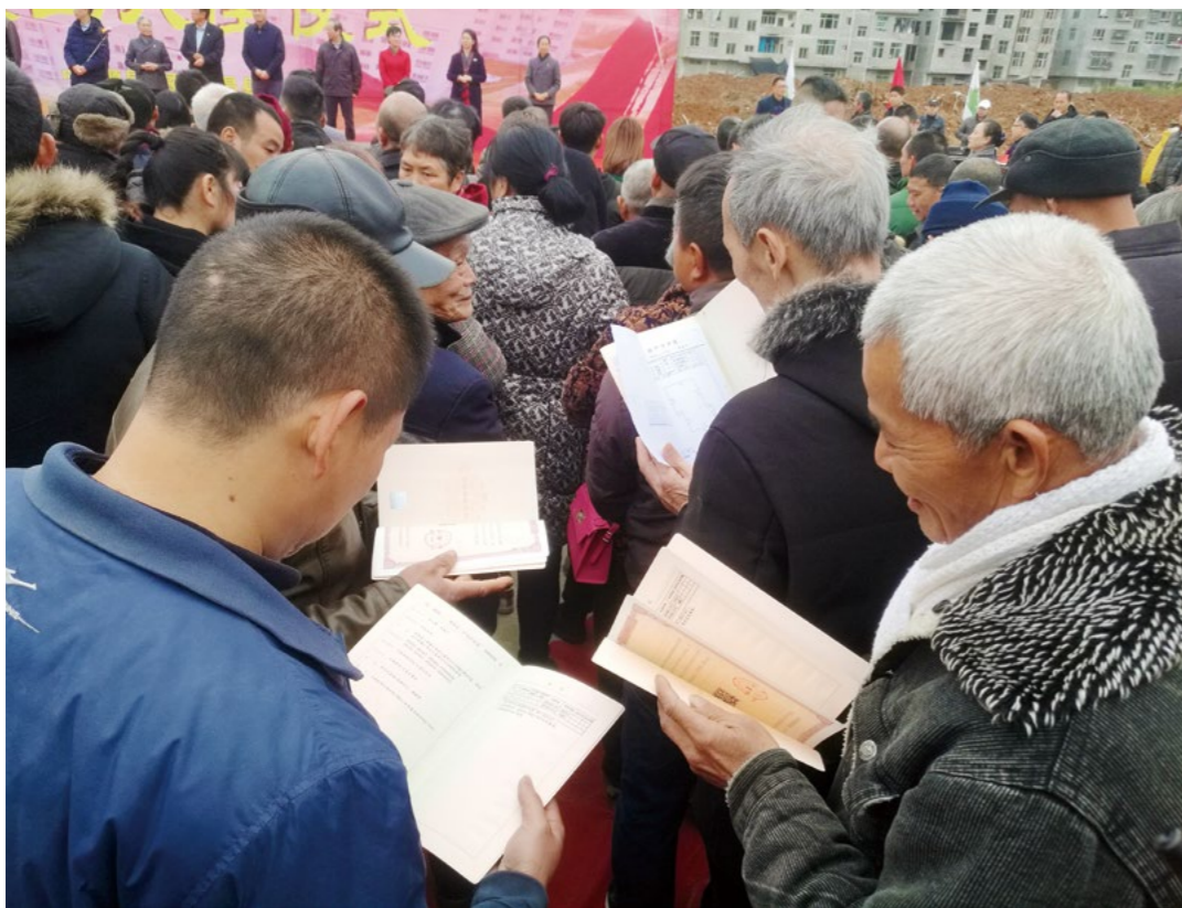
乡亲领到房产证后，忍不住一次次翻看，喜悦之情溢于言表。

多位来自福鼎、福州、莆田、厦门的慈济志工及顺昌当地志工，一百余位受灾乡亲和志愿者，共聚现场欢庆，见证喜悦而值得纪念的隆重时刻。