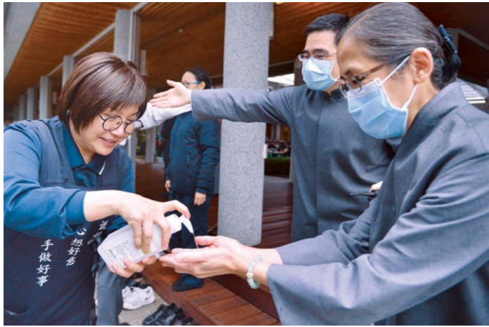
年节期间，在静思精舍团聚的慈济人配合防疫，量体温、勤洗手、戴口罩，保护自己也保护别人。

“这波疫情，已经唤起人人的警觉心，在公共场所戴起口罩，而且许多游乐场所不像过去那么拥挤。人总是要有一份自我警惕心，谦卑自己、尊重别人。希望大家向亲友宣导，少荤多素，最好就此茹素，减少杀业。”