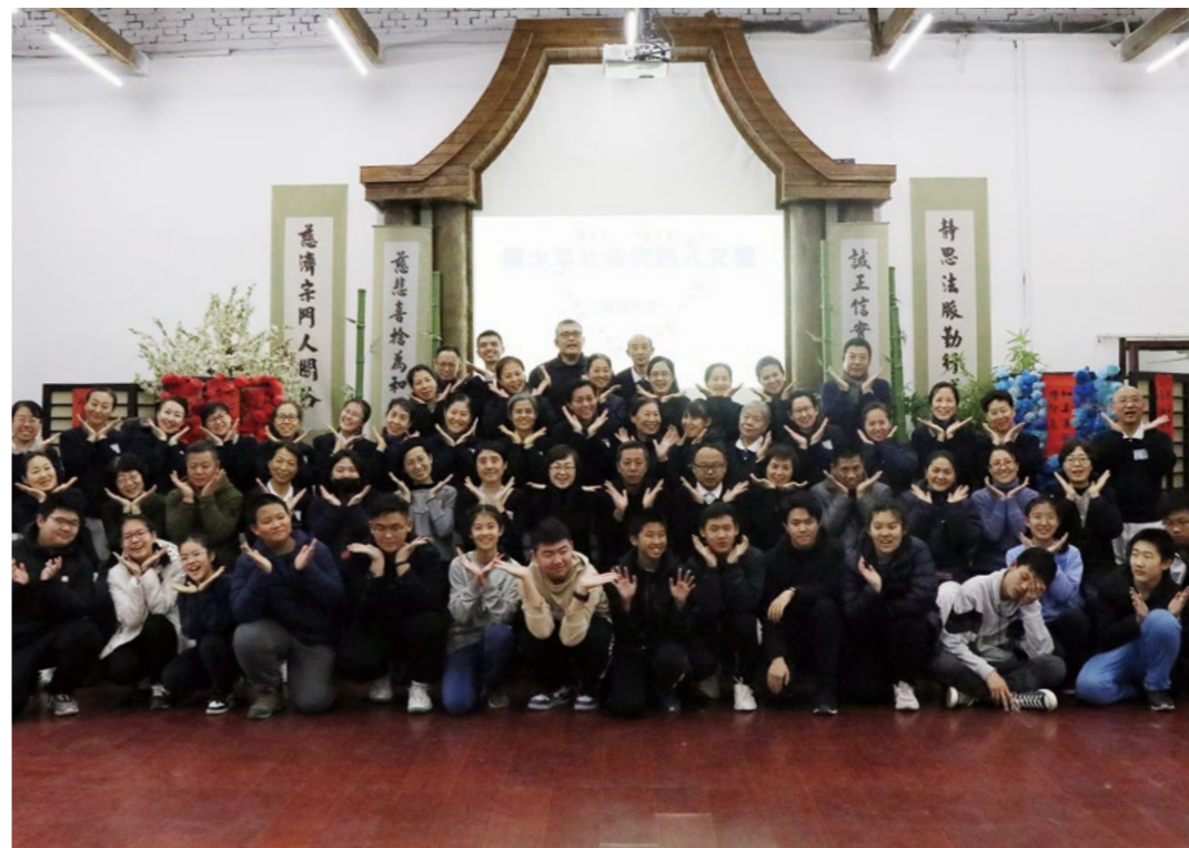
一天的人文课程圆满完成，志工和孩子们留下欢喜和祝福。