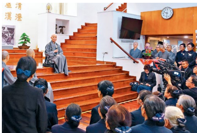
上人抵达台中分会旧会所，关心绕视整体空间后，再度坐在昔日熟悉的位置与志工谈话。（1月8日）