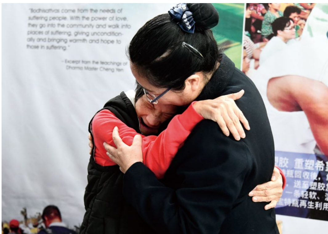
关怀户阿琼看到慈济志工就如同见到家人一般温馨拥抱。

大小，莲花般的清净心可以守护大地和心灵。八十四岁的阿迪奶奶守护大地的这念心让大家非常敬爱。