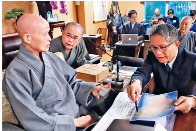
熊士民副执行长报告“国际讯息与慈济足迹”，上人尤其担忧澳洲的林火灾情。（1月7日）

成就志业的力量，是来自十方大众。上人感动表示，有许多慈济人或慈济会员，是务农、做工，辛苦劳动维生，他们在清贫的生活中点滴累积善款护持志业，再辛苦都甘愿，心意真诚，让人深感敬佩；而且许多人是用生命做慈济，做到人生最后一口气，大爱无量，每一位都很重要，慈济少不了这点点滴滴的每一