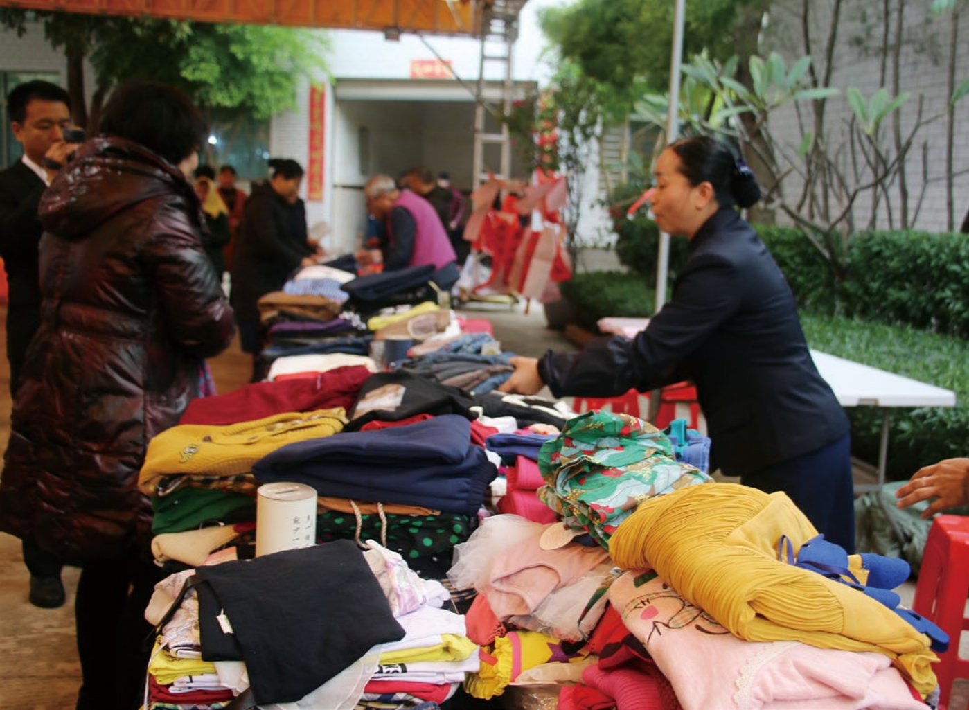
志工介绍回收惜福衣，倡议减少欲望，节约资源，延长物命。