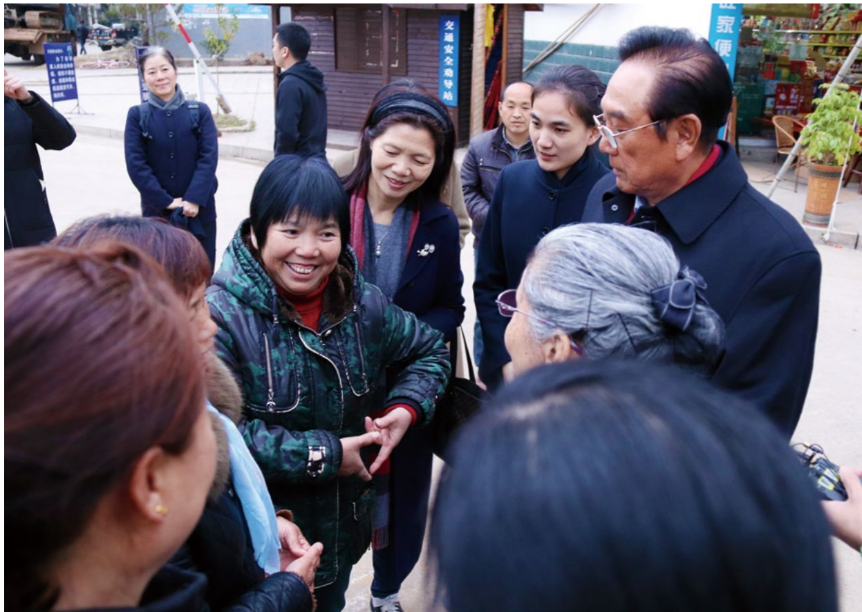
村民兴奋地向来宾介绍正在练习手语《感恩的心》。