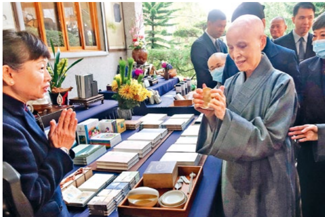
上人绕视“精舍过心年”活动摊位，试用以回收纸餐盒再制的环保餐具。（1月26日）