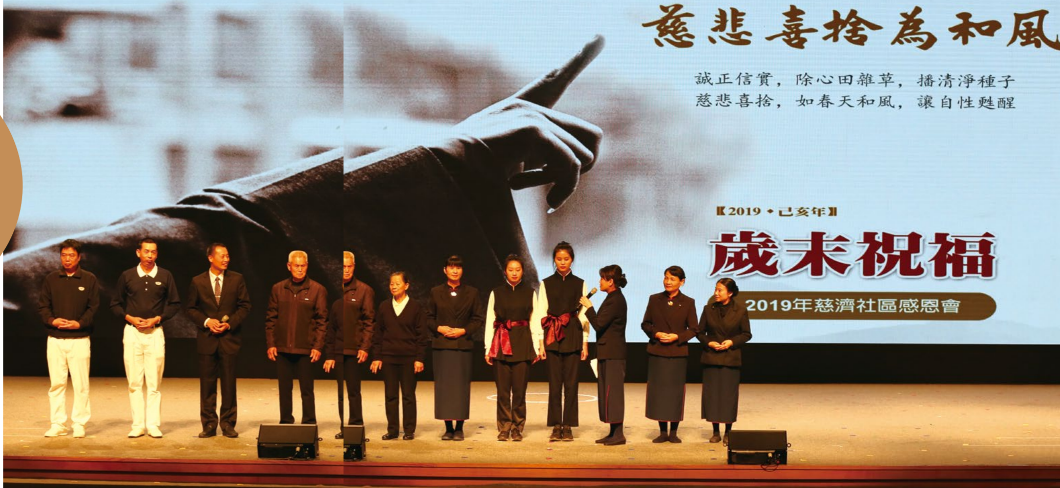
撰文/攝影 廈門真善美志工